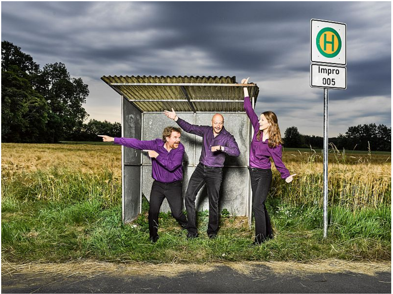
Impro 005.

Seit über 25 Jahren lockt „Die ultimative Improshow“ von IMPRO 005 Zuschauerscharen in vollbesetzte Häuser. In Bergkamen macht die Gruppe nun auch Halt und präsentiert am Freitag, den 04.04.2025 um 20.00 Uhr im Studiotheater Bergkamen ihre einzigartige Show, in der das Publikum bestimmt, wohin die Reise geht!