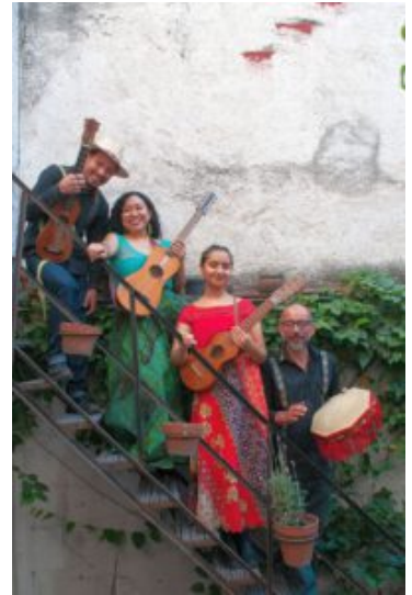
La Flota del Son.

Mitreißend, lebendig und voller Geschichte: „La Flota y El Son“ entführt das Publikum am Montag, den 13.10.2025 um 20.00 Uhr im Trauzimmer Marina Rünthe in die Klangwelt des Son Jarocho – einer Musiktradition aus Veracruz, die ihre Wurzeln in indigenen, westafrikanischen und spanisch-barocken Einflüssen hat. Im Mittelpunkt stehen die Geschwister Vega, deren Familie seit fünf Generationen zu den bedeutendsten Hütern dieser Kunstform gehört. Mit feinem Gespür verbinden sie kulturelle Wurzeln, familiäres Erbe und ihre immense internationale Bühnenerfahrung zu einem unverwechselbaren Musikerlebnis. Charakteristisch für den Veracruz-Sound sind humorvolle, poetische Texte über Liebe, Natur, Seeleute oder das Landleben. Doch kein Konzert gleicht dem anderen: Melodien, Rhythmen und Verse werden stets neu arrangiert und improvisiert – jede Aufführung wird so zu einem einzigartigen Fest der Musik.