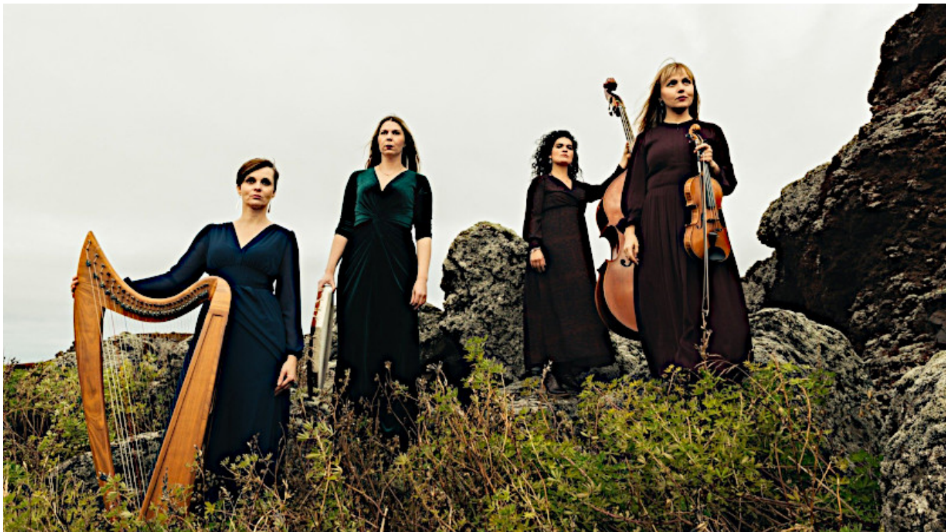
Folk Ensemble Umbra.

Nein, es sind keine Feen zu hören – man könnte es aber meinen, denn Umbra lädt am Montag, den 12.05.2025 um 20.00 Uhr im Trauzimmer Marina Rünthe zum Träumen ein. Zwischen spirituellen, weltlich mittelalterlichen Melodien und traditionellen Liedern bezaubern die vier Isländerinnen gekonnt jedes Publikum.