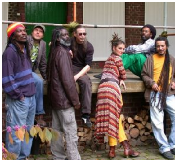
Riddim of Zion

Gleich vier Bands rocken sich mit dem Publikum durch einen runden Open Air Konzertabend.