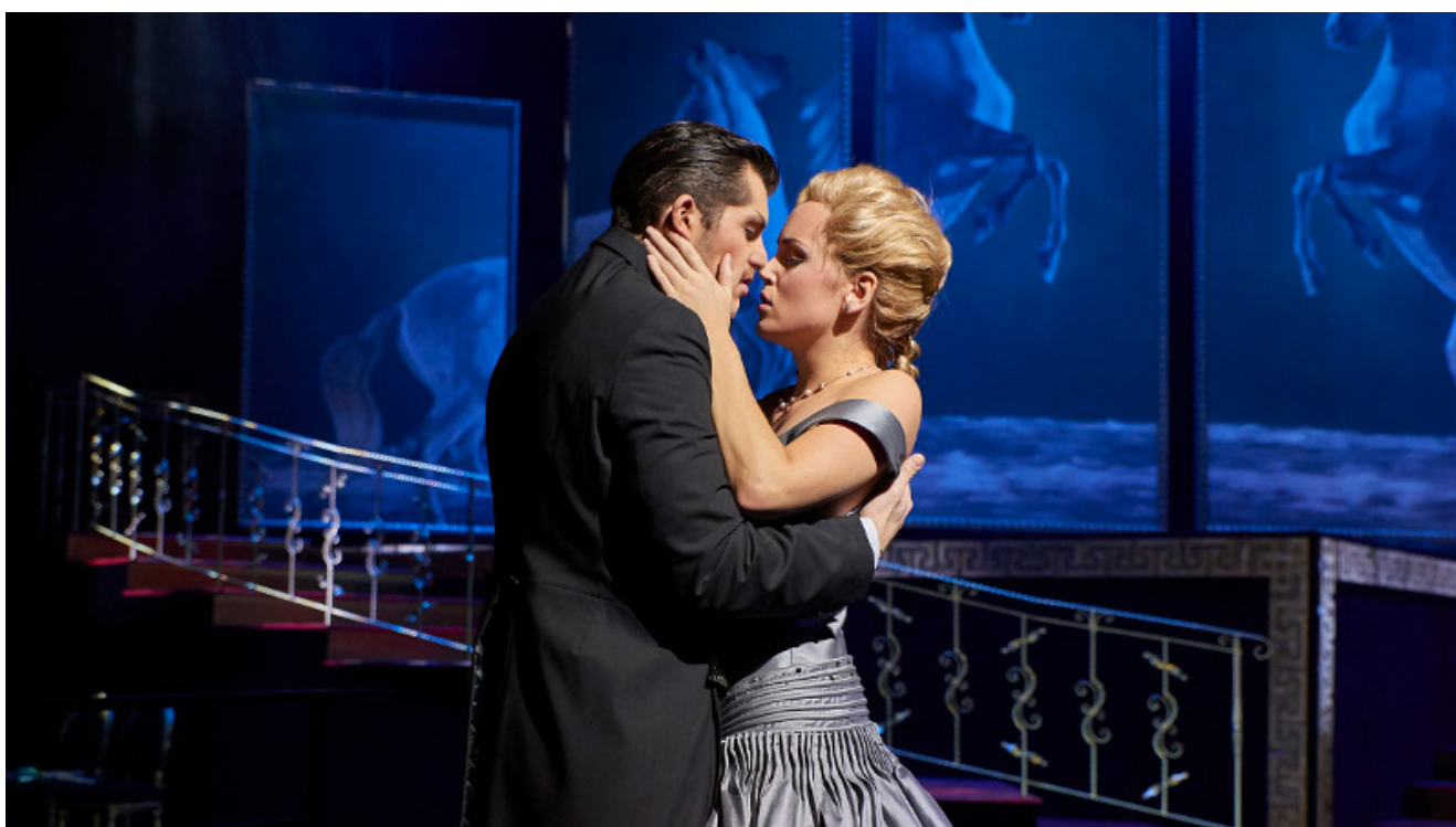
Szene aus „Land des Lächelns“.

In der Saison 2019 / 2020 wartet ein spannendes Programm im Dortmunder Opernhaus auf die Abonentinnen und Abonneten der Theaterfahrt Dortmund. An sechs Terminen kann man mit dem Theaterbus, aber auch als „Selbstfahrer“, zu anregenden, spannenden und begeisternden Theaterabenden fahren.