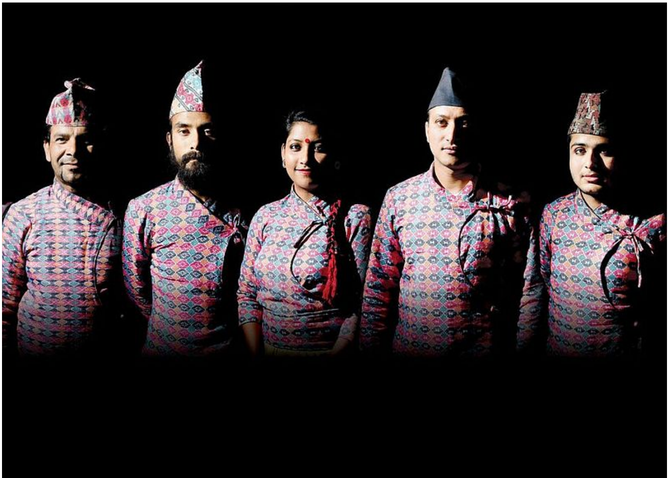
Night Quintet

Neue Töne aus dem Himalaya mit der Gruppe Night aus Nepal erklingen am Montag, 27. Mai, ab 20 Uhr in der Reihe „Klangkosmos Weltmusik“ im Trauzimmer Marina Rünthe