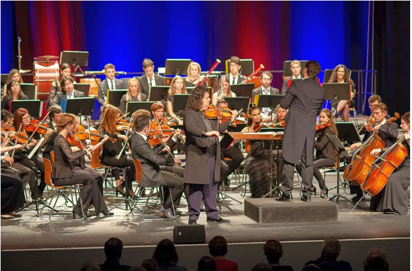
Die M: LW Festival Philharmonie.

Herausragende Musiker und eine mitreißende Sopranistin begleiten die „M: LW Festival Philharmonie“ beim diesjährigen Silvesterkonzert mit „Wiener Mélange im Dreivierteltakt“ im Bergkamener studio theater: