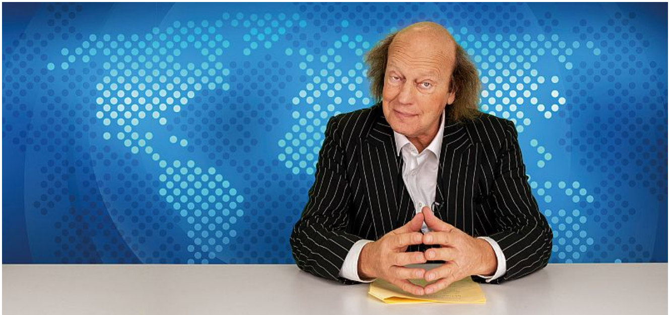
Arnulf Rating.

In der nächsten Kabarettveranstaltung am Freitag, 8. März, um 20.00 Uhr im studio theater bergkamen zerlegt Arnulf Rating mit seinem wortgewaltigen Programm „tageschauer“ gekonnt aktuelle Themen aus Presse und Zeitgeschehen.