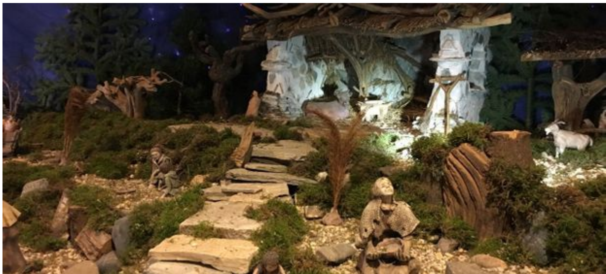
Krippenlandschaft in der Friedenskirche

Vieles ist wegen der Corona-Pandemie nicht möglich, die bekannte Krippenlandschaft, die in der Adventzeit in der Friedenskirche aufgebaut wird, kann man sich aber trotzdem während der Öffnungszeiten ansehen, Wem das zu unsicher ist,