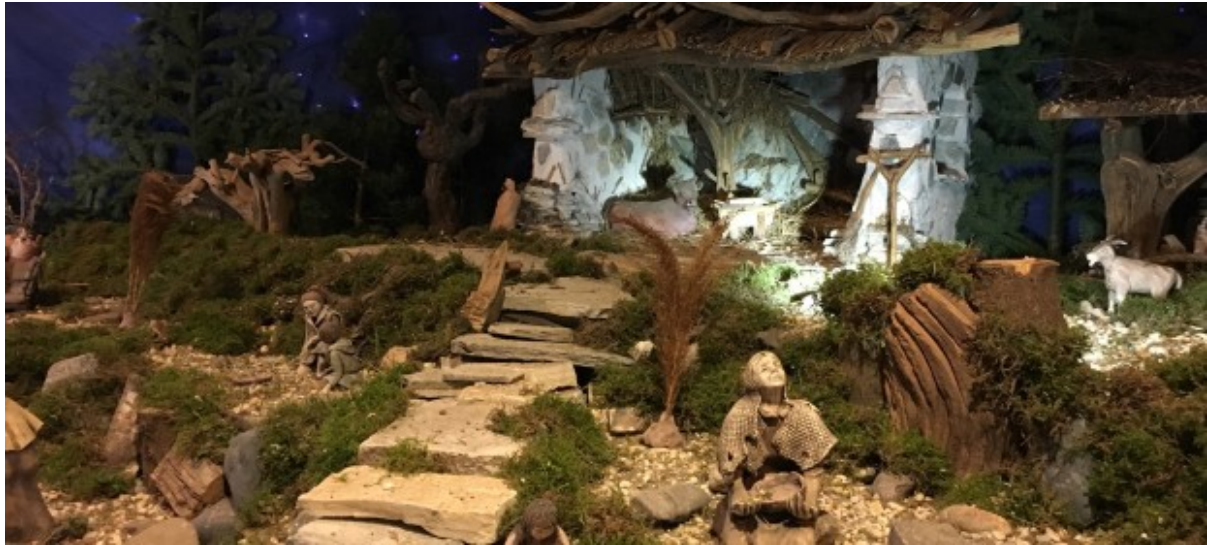
Krippenlandschaft in der Friedenskirche.

Die Friedenskirchengemeinde schließt sich der Empfehlung der Landeskirche an und wird ab sofort und über die Weihnachtsfeiertage – voraussichtlich – bis zum 10.01.2021 auf alle Präsenzgottesdienste und andere kirchliche Versammlungen (in Gebäuden und unter freiem Himmel) verzichten. Damit werden alle unsere Gottesdienste in den Kirchen oder auch draußen abgesagt.