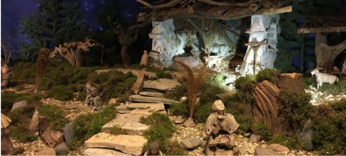
Krippenlandschaft in der Friedenskirche

Vieles ist wegen der Corona-Pandemie nicht möglich, die bekannte Krippenlandschaft, die in der Adventzeit in der Friedenskirche aufgebaut wird, kann man sich aber trotzdem während der Öffnungszeiten ansehen, Wem das zu unsicher ist, findet Fotos von der Krippenlandschaft auf der Homepage der Friedenskirchengemeinde.