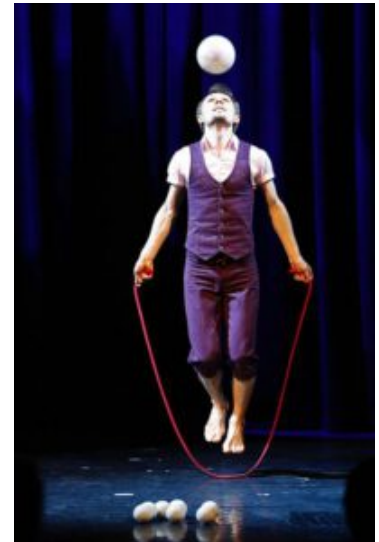
Krystallpalast Varieté Leipzig: „Newcomershow – das internationale Varieté-Festival 2015“, Leipzig, 04.07.2015