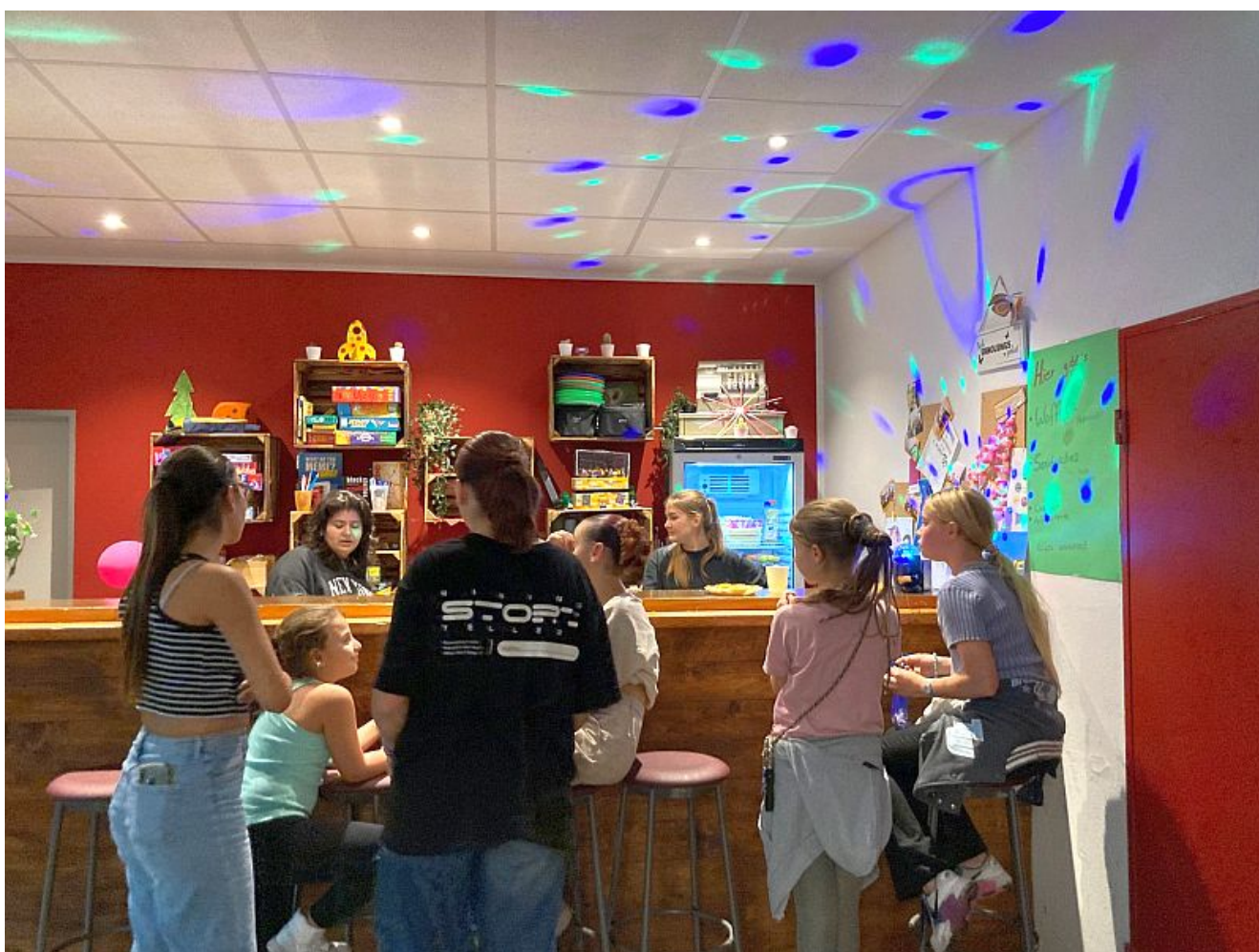
Chill-Zone im Jugendzentrum.

Das Kinder- und Jugendbüro (kijub) lädt gemeinsam mit der evangelischen Friedenskirchengemeinde, der Martin-Luther-Kirchengemeinde, der Jugendkunstschule und der Stadtbibliothek