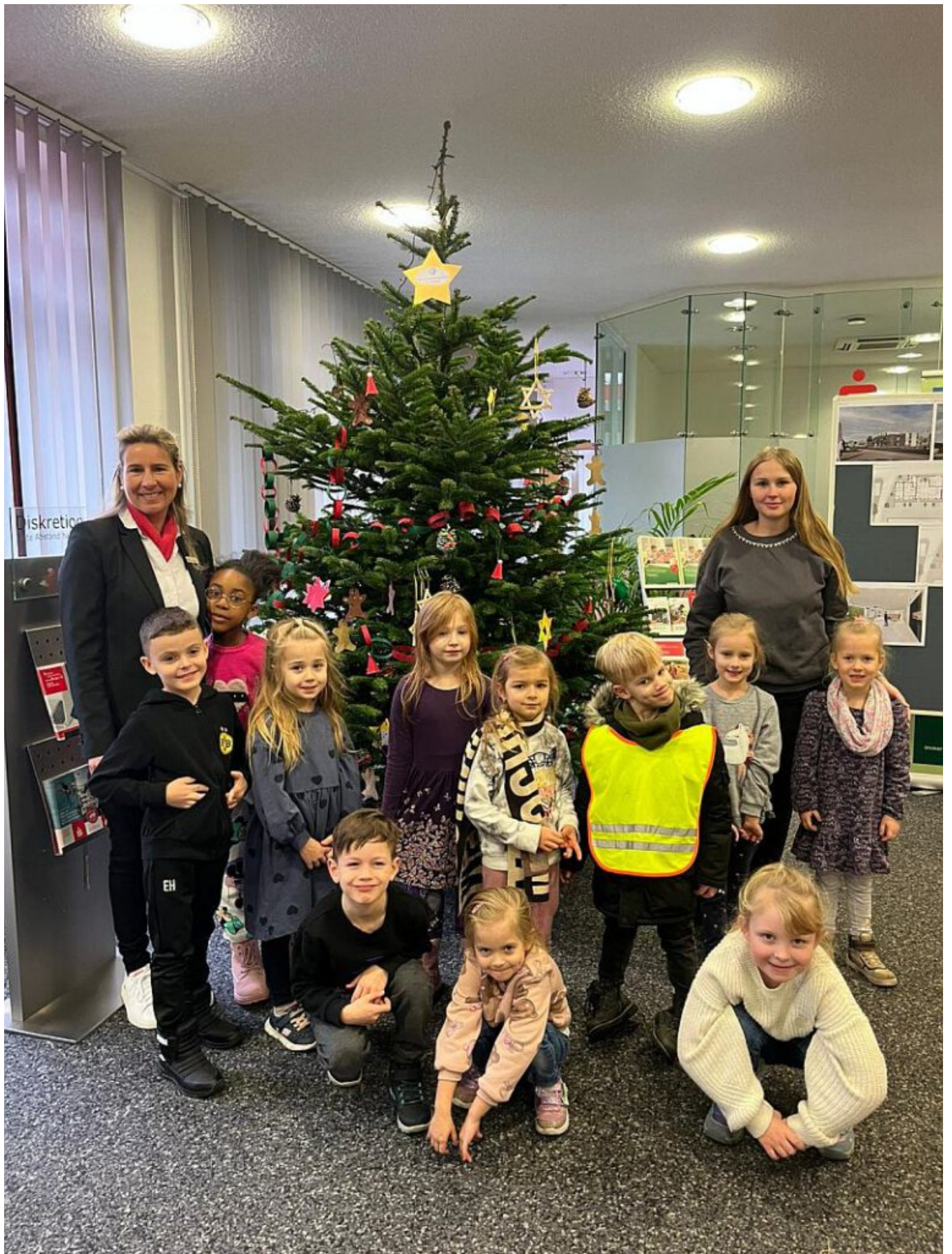
Die Vorschulkinder des Kindergartens St. Elisabeth in Oberaden haben weihnachtlichen Glanz in die Sparkasse gebracht. 11