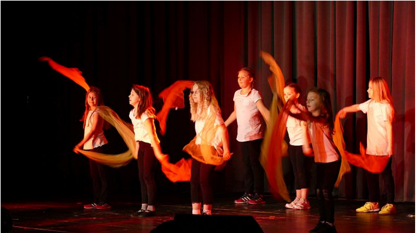
Die neue Tanz-AG der Schillerschule.