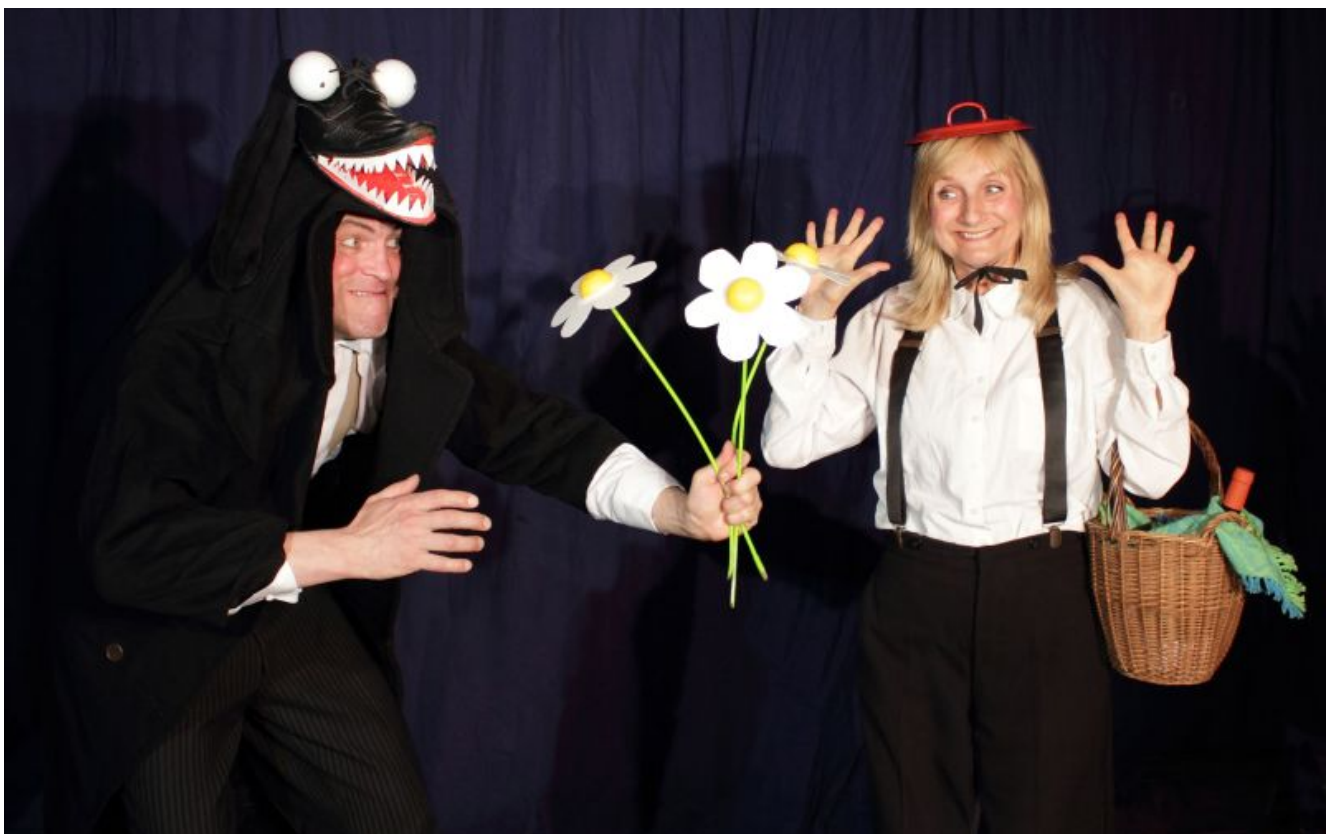
Szene aus „Rumpelfrosch im Glück“.

Die Kindertheatersaison 2016/17 des Jugendamtes geht am Mittwoch, 15. März, im studio theater mit der Aufführung „Rumpelfrosch im Glück“ des Theater 1+1 zu Ende. Zum Abschluss stehen nicht weniger als sieben Märchen in einem bunten Mix auf der Bühne.