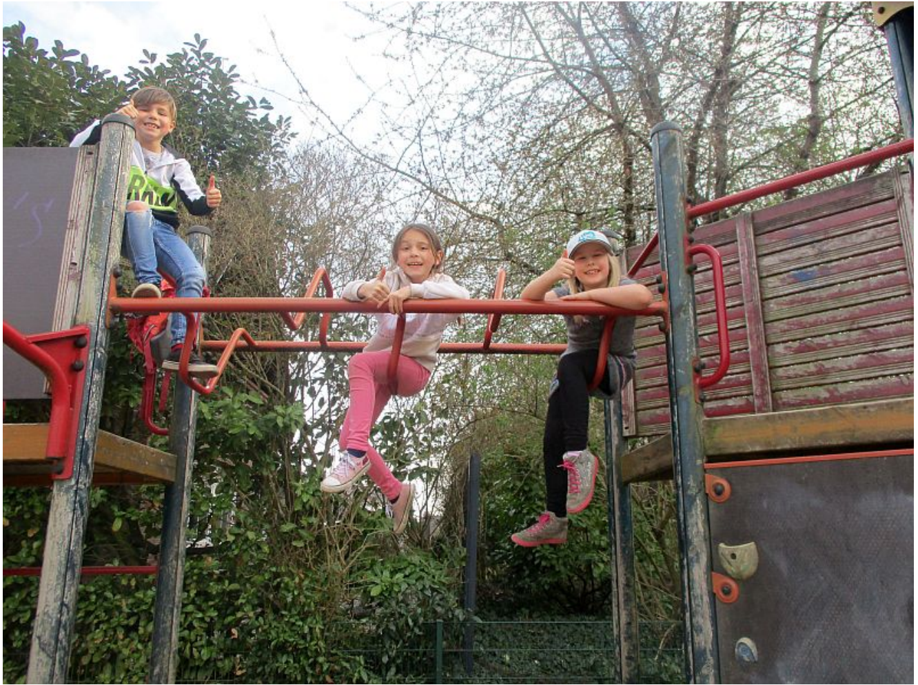
Teilnehmer des ersten Bergkamener Spielplatztests.

Der erste Spielplatztest des städtischen Kinder- und Jugendbüros, der in den vergangenen Osterferien angeboten wurde, kann als toller Erfolg verbucht werden. 14 Kleingruppen, meist bestehend aus Geschwisterkindern oder besten Freunden oder Freundinnen, haben eine Woche lang die Bergkamener Spielplätze getestet. Das Team des Kinder- und Jugendbüros wollte mit diesem Angebot die Meinung von Kindern und Jugendlichen zu den einzelnen Spielflächen erfahren, um diese Expertenpositionen dann auch in die weitere Spielplatzplanung einfließen zu lassen.