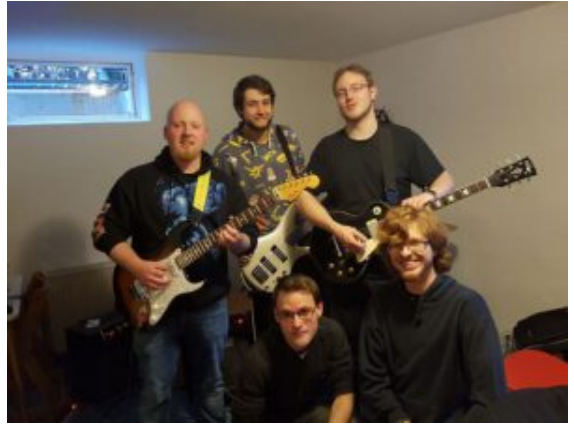
Power Word Kill.

In diesem Jahr mussten abermals coronabedingt viele Veranstaltungen in Bergkamen und im Jugendzentrum Yellowstone ausfallen. Doch für die Veranstaltung zur nachtfrequenz21 haben sich das veranstaltende Kinder- und Jugendbüro und die Jugendkunstschule der Stadt Bergkamen noch einmal extra ins Zeug gelegt und greifen das erfolgreiche Veranstaltungskonzept aus dem Vorjahr noch einmal auf. Unter Einhaltung der Hygiene- und Coronoschutzbedingungen findet somit die nachtfrequenz21 als Open-Air mit limitierter Besucheranzahl und Abstand auf der Fläche und Maskenpflicht, außer am Sitzplatz, statt.