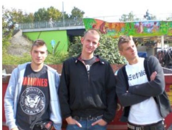
MEALS ON WHEELS.

geschmiedet. Von Jugendlichen für Jugendliche – das ist die Idee der Nachtfrequenz. Sie lädt zum Schauen, Hören und vor allem zum Mitmachen ein.