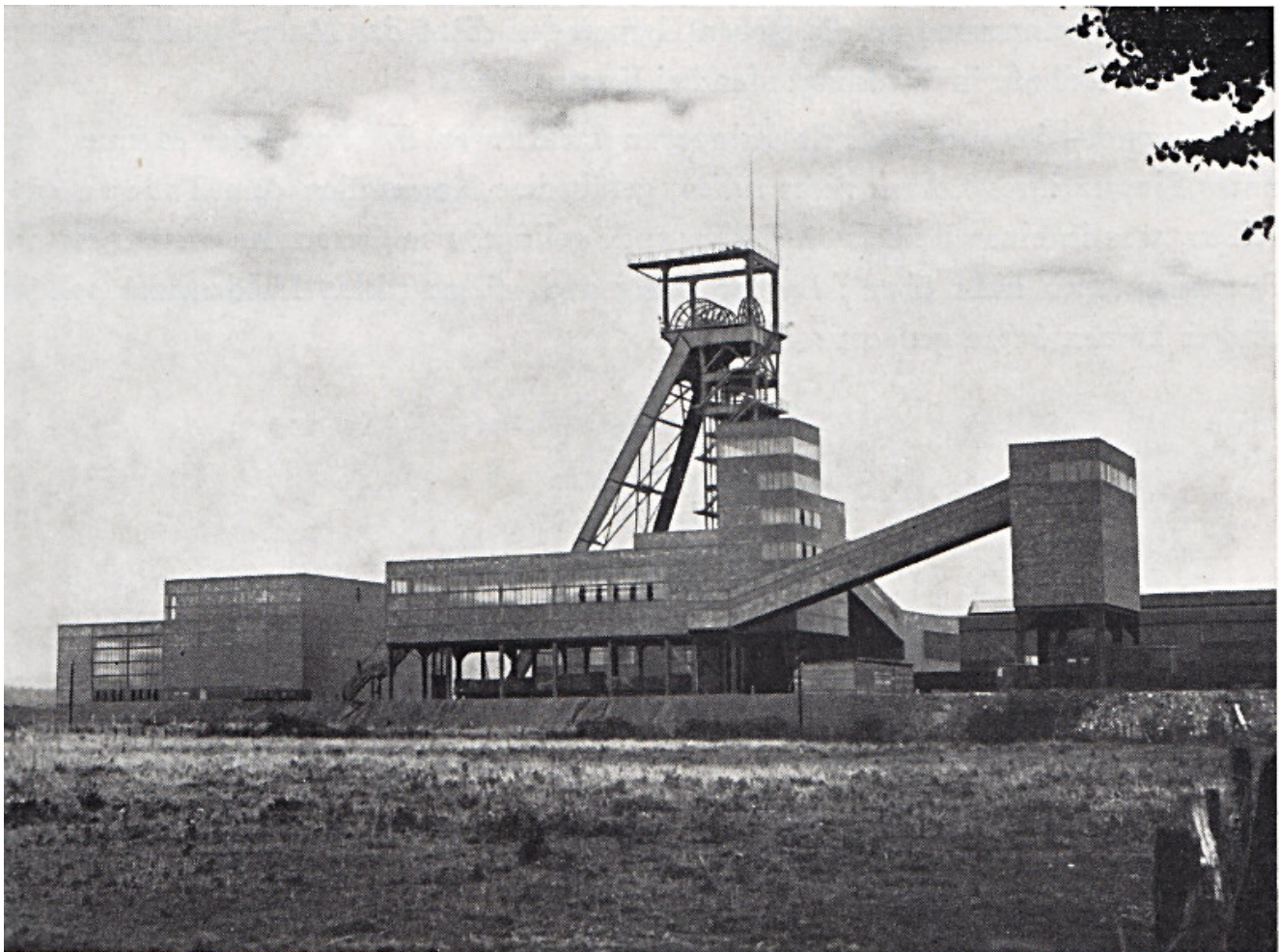
Die Zeche Grimberg 3/4 Anfang der 1950er Jahre.

Lediglich 64 Grimberg-Kumpel konnten trotz des unermüdlichen Einsatzes zahlreicher Grubenwehren lebend geborgen werden. Eine effektivere Rettungsaktion, und das war eine bittere Lehre des Grubenunglücks, verhinderte die schlechte technische Ausrüstung der Grubenwehrmänner. So ließ es der begrenzte Aktionsradius der Beatmungsgeräte nicht zu, dass die Rettungskräfte bis zur 2. Sohle vordringen konnten. Dort lag der Ausgangspunkt des Unglücks. Als Konsequenz aus dem Bergkamener Grubenunglück und den deutlichen Versäumnissen im „Dritten Reich“ und der anschließenden Besatzungszeit wurde die Entwicklungen im Sicherheitsbereich sowohl für die Grubenwehr als auch für den einzelnen Bergmann energisch vorangetrieben.