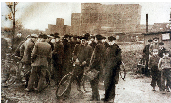
Wartende Menschen vor der Unglückszeche Grimberg 3/4.