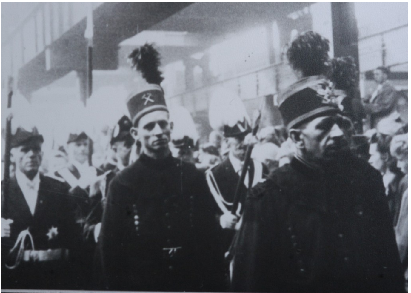
Trauerfeier für die Opfer des Grubenunglück am 20. Februar