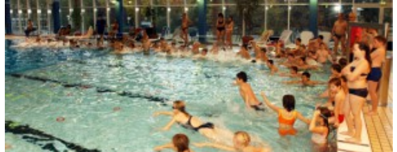
Das Hallenbad in Bergkamen.

Am Donnerstag, 25. Oktober, feiert das Hallenbad Bergkamen sein 50-jähriges Bestehen. Denn am 25. Oktober 1968 öffnete das Hallenbad am Stadion zum allerersten Mal die Türen. Die GSW laden daher alle Schwimmerinnen und Schwimmer zu einem Tag der offenen Tür. Das bedeutet: freier Eintritt für alle.