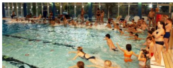
Das Hallenbad in Bergkamen.

Am Donnerstag, 25. Oktober, feiert das Hallenbad Bergkamen sein 50-jähriges Bestehen. Denn am 25. Oktober 1968 öffnete das Hallenbad am Stadion zum allerersten Mal die Türen. Die GSW laden daher alle Schwimmerinnen und Schwimmer zu einem Tag der offenen Tür. Das bedeutet: freier Eintritt für alle.