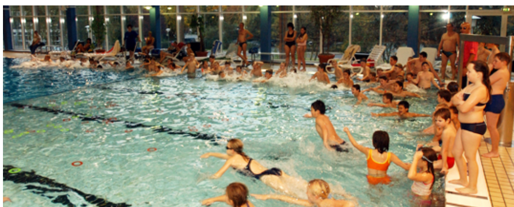
Das Hallenbad in Bergkamen.

Aufgrund der Herbstferien ändern sich die Öffnungszeiten der GSW-Hallenbäder in Kamen und Bergkamen. Durch den Wegfall des Schulschwimmens können die GSW verlängerte Zeiten für große