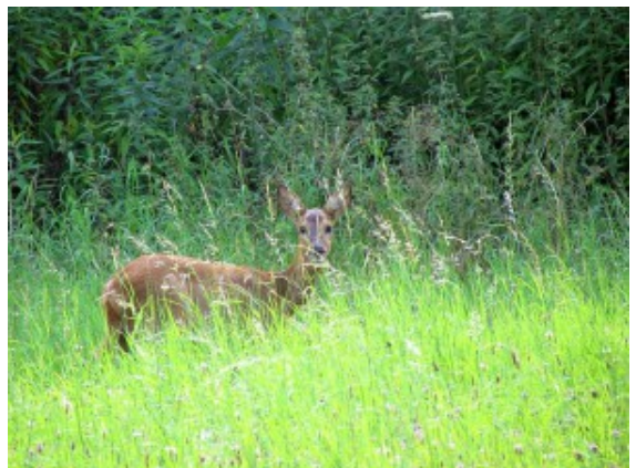
Ein Reh auf eine Wiese am Rande des Naturschutzgebiets Beversee