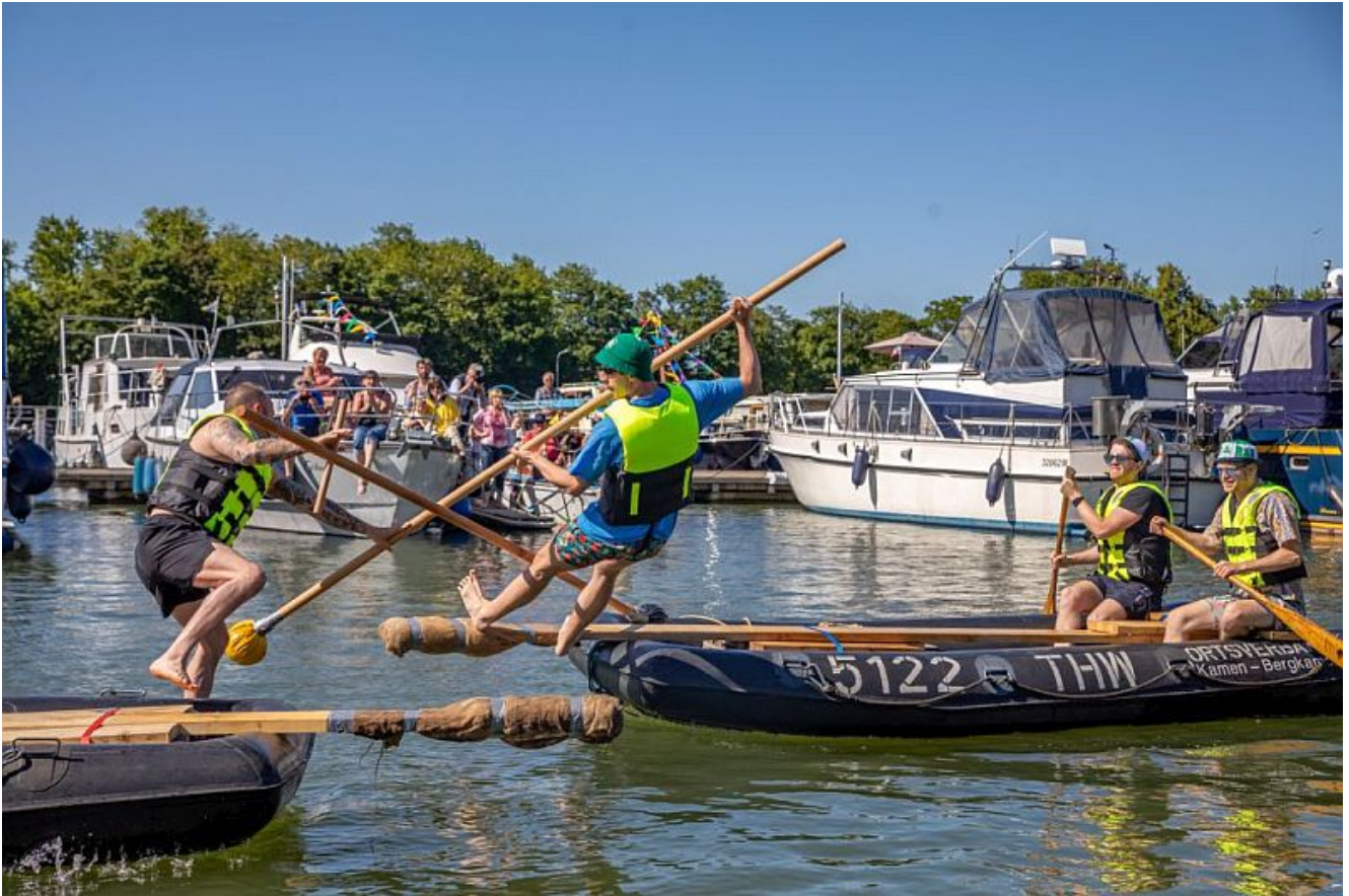
Fischerstechen beim Hafenfest 2024.

Auch in diesem Jahr sucht die Stadt Bergkamen wieder Helferinnen und Helfer für das 22. Hafenfest im Westfälischen Sportbootzentrum – Marina Rünthe. Das Hafenfest wird vom 7. bis 9. Juni stattfinden. Einsatzgebiete sind beispielsweise die Fahrradwache, das Kassieren der Fährfahrten oder die Betreuung verschiedener Spielstationen.