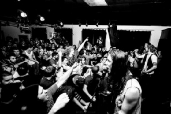
The Hunters vor Publikum

The Hunters aus Kanada rocken sich bereits seit sieben Jahren durch die Punkrockwelt und touren über den ganzen Globus, ohne dabei zu ermüden. In diesen jungen Männern brennt die Flamme der Leidenschaft zu ihrer Musik. Dabei schreiben sie ganz nebenbei Hymnen für die Ewigkeit. Als sie einst im Keller Ihrer damaligen Schule anfangen zu proben, konnte keiner in der Band erahnen, dass man ein paar Jahre später mit den großen Vorbildern wie Anti-Flag, Mustard Plug, Agnostic Front, Against All Authority, The Briggs & The Flatliners mal die Bühne teilen oder sogar zusammen eine Tournee spielen würde. Mittlerweile ist die Band dem Support-Status entsprungen und reist der Tage selbst als Headliner durch Europa. Zum ersten Mal gastiert die Band auch in Bergkamen. Der treibende Punkrock, mit smarten Blueslinien und Folkelementen ermuntert zum Mitsingen und Hände in die Luft recken.