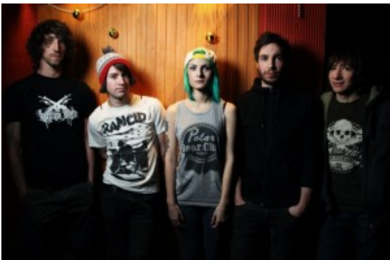
Die Scarlet Pills aus St. Petersburg/Russland

Gemischte Livetöne aus den Bereichen Alternative, Poppunk, Punkrock, Indie, Crossover und Emorock sind vertreten. Das Team des Jugendzentrums und das Independent-Label „Horror Business Records“ laden zu einem bunten Musikabend ein.