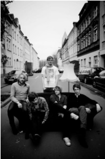
Die Bergkamener Jungs von Nothing but Rascals mit Wahlheimat Dortmund

No Average ist eine junge Band aus Bergkamen, die seit 2009 in der jetzigen Formation existiert. Ihr Repertoire reicht von soften Schmusesongs bis hin zu kräftigen Hard Rock Songs und zeichnet sich nicht nur durch die fetzigen Gitarrensounds, dem stimmungsgeladenen Schlagzeug und der Stimme der Frontfrau aus, sondern ebenso durch die instrumentale Umsetzung der Songs der Band, die ihre Arbeit und ihre Experimentierfreudigkeit unterstreichen. Da sie nun ihr erstes Album "Breaking the Silence " aufnehmen, gilt es nun dieses zu präsentieren. Ihren Auftritt im Yellowstone möchten die jungen Musiker nutzen, um ihre ersten Aufnahmen zu feiern sowie als Sprungbrett für weitere Auftritte.