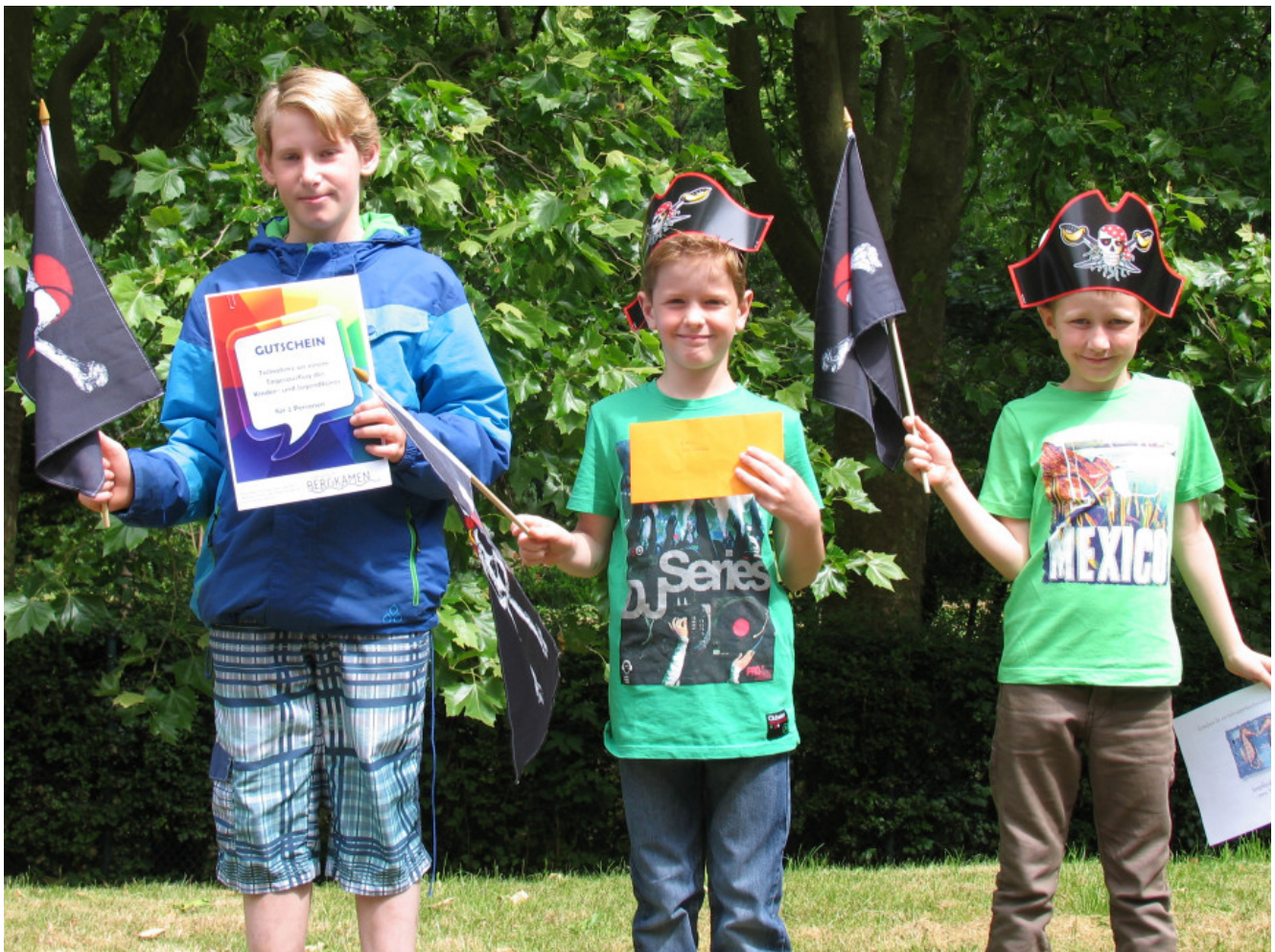
Die Gewinner der Hafenfest-Schatzsuche

Mit großem Erfolg hat die Stadtverwaltung Bergkamen beim Hafenfest 2015 eine Schatzsuche für Kinder über das gesamte Hafenfestgelände durchgeführt. Mehr als 250 Kinder haben mit Begeisterung den Schatz der Marine Rünthe gefunden.