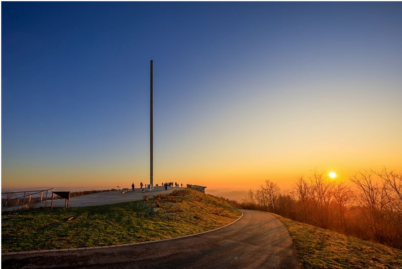
Sonnenuntergang auf der Halde Großes Holz.

Es gibt in ganz Bergkamen – und der Region – wohl keinen schöneren Ort, um den sommerlichen Sonnenuntergang zu sehen. Genießt dieses Ereignis an einem der längsten Tage des Jahres – und bekommt dazu noch viele Infos rund um die Entstehung der Halde.