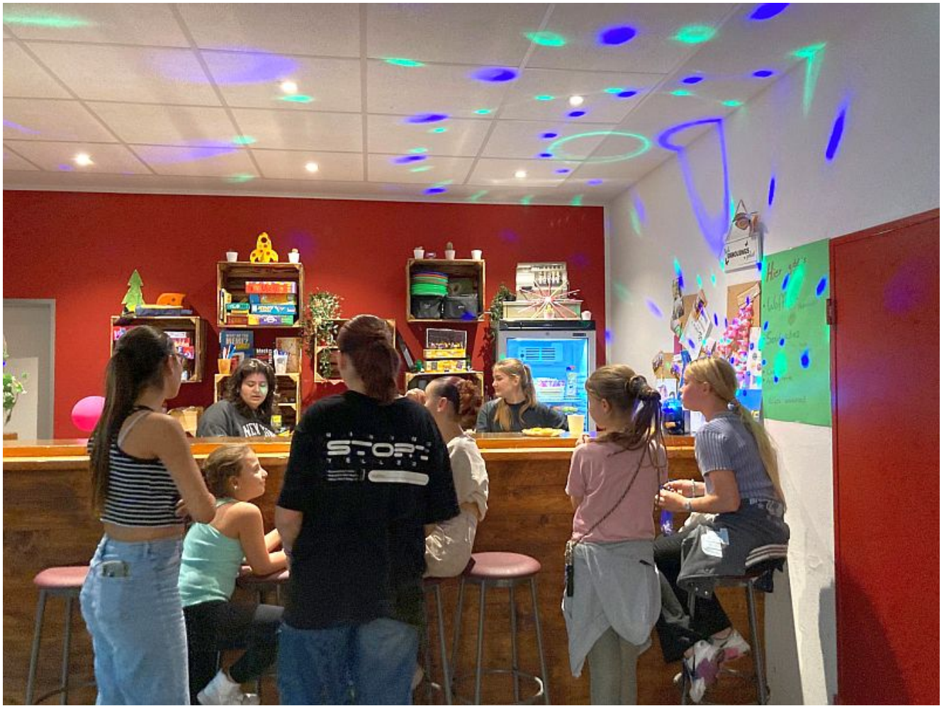
Chill-Zone im Jugendzentrum.

Das Kinder- und Jugendbüro (kijub) lädt gemeinsam mit der evangelischen Friedenskirchengemeinde, der Martin-Luther-Kirchengemeinde, der Jugendkunstschule und der Stadtbibliothek herzlich zu den „Next Level! – Kinder- und Jugendpartizipationstagen“ ein. Die Veranstaltung findet vom 23. bis 26. Januar 2025 rund um die Bergkamener Jugendeinrichtungen statt und bietet eine spannende Plattform für Kinder und Jugendliche, um aktiv teilzunehmen und ihre Ideen einzubringen. Meinungen, Bedarfe und Ideen der Kinder und Jugendlichen werden in Umfragen, Schwarzen Brettern und anderen Beteiligungsformaten gesammelt. Sie sollen in die Planungen für die zukünftige Entwicklung der Jugendarbeit der Stadt Bergkamen einfließen und die Zielrichtung vorgeben.