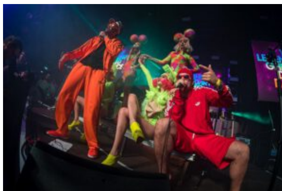
Legendary □Ghetto Dance Band.

Es soll wieder ein Fest für Familien sein: das 23. Marina-Hafenfest. Bis auf Essen und Trinken und den Fährfahrten des THW brauchen die kleinen und großen Besucherinnen und Besucher des maritimen Vergnügens in der Marina Rünthe nichts zu bezahlen. Wer kommen will, sollte beachten, dass es nur wenige Parkplätze gibt. Besser ist, gleich zu Fuß, per Rad oder mit den Linien- und Pendel-Bussen zu kommen.