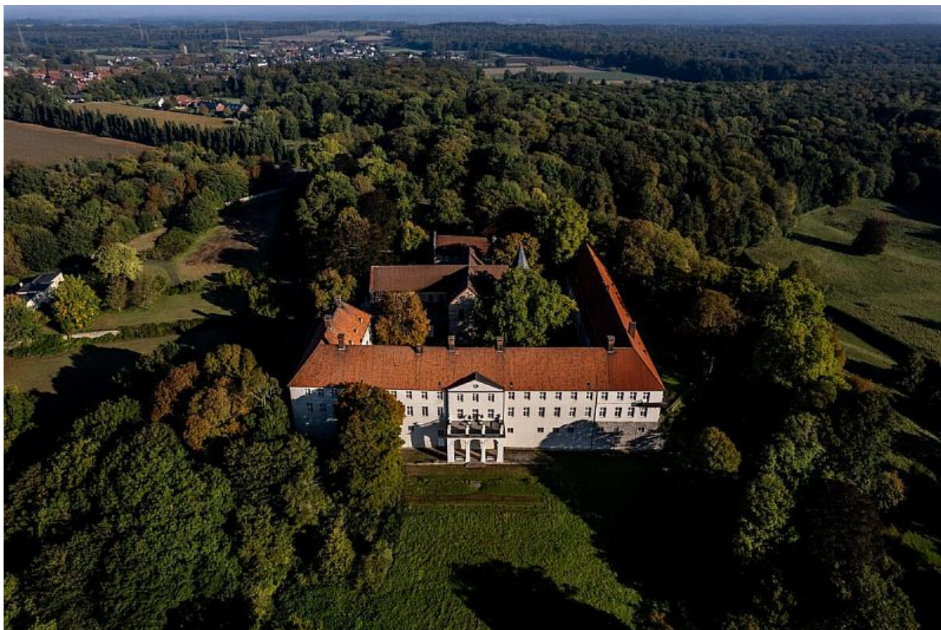
Schloss Cappenberg mit Stiftskirche.

Das Museum Schloss Cappenberg ist beim beliebten Schlösser- und Burgentag wieder mit dabei. Am Sonntag, 15. Juni, ist der Eintritt zur Feier des Tages kostenfrei. Und es gibt eine Sonderführung zum Thema „La Dolce Vita im Museum Schloss Cappenberg“.