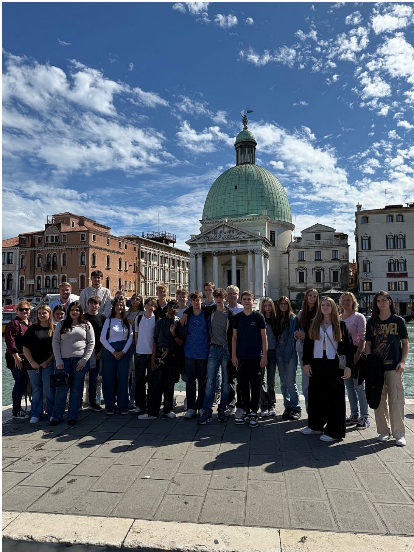
Die drei zehnten Klassen der Realschule Oberaden verbrachten ihre Abschlussfahrt in diesem Jahr am wunderschönen Gardasee,