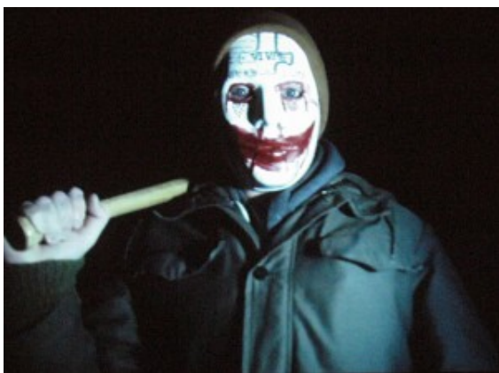
Ausschnitt aus dem Horrofilm „Hylophobie“

Unterricht kann manchmal für eine Schule auch zu recht praktischen Ergebnissen führen. Ein Jahr lang haben sich 28 Schülerinnen und Schüler des Gymnasiums mit dem Thema „Film“ auseinandergesetzt. Ein Beitrag informiert in wenigen Minuten über alles, was für den Besuch der „Penne“ wichtig ist. Er findet jetzt als sogenannter Image-Film einen Platz auf der Schulhomepage.