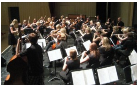
A-Orchester des Bachkreises Bergkamen

Der Lions Club BergKamen fördert mit einer aktuellen Spende über 3000 Euro die musikalische und pädagogische Arbeit des Bergkamener Bachkreises.