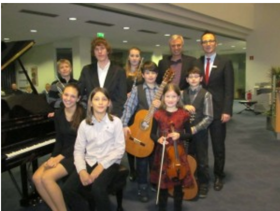
Die Teilnehmer des Preisträgerkonzerts von „Jugend musiziert“.