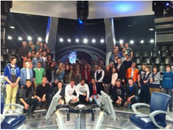
Teilnehmer des Planspiels Börse im Kölner RTL-Studio.