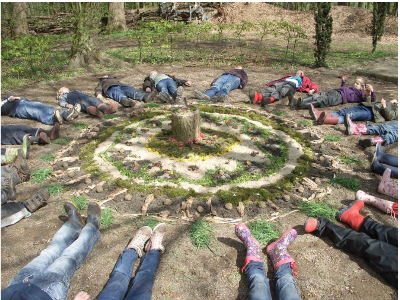
LandArt auf der Ökologiestation

Interessierte Kinder können bei der Jugendkunstschule Bergkamen angemeldet werden. Informationen gibt es unter 02307/9835027 oder 02307/965462.