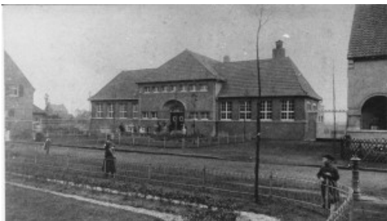
Ehemaliges Wohlfahrtsgebäude in der Bergarbeitersiedlung Schönhausen

Vor genau 80 Jahren begann eines der dunkelsten Kapitel der Geschichte der heutigen Stadt Bergkamen in der Zeit des Nationalsozialismus: Im „Konzentrationslager Schönhausen“ im heutigen Gemeindehaus der Freikirchlichen Gemeinde an der Lentstraße wurden die ersten Kritiker und Gegner des Hitler-Regimes inhaftiert.