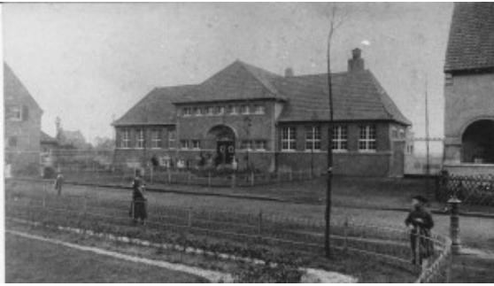
Ehemaliges Wohlfahrtsgebäude in der Bergarbeitersiedlung Schönhausen