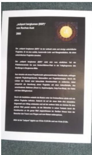
Plakat des Kulturreferats zum „subport bergkamen“