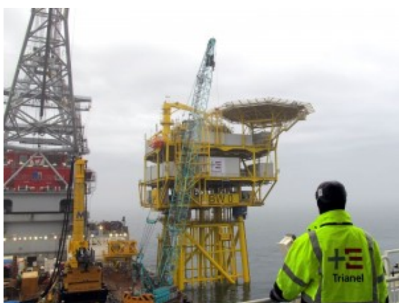
Bau der Umspannplattform

Gern würden die Gemeinschaftsstadtwerke Ökostrom mit Windkraftanlagen auf der Bergkamener Bergehalde „Großes Holz“ produzieren. Bis es soweit ist, kann es aber noch eine Weile dauern. In der Nordsee ist das kommunale Versorgungsunternehmen schon etwas weiter. Die GSW sind dort am Bau eines Windpark beteiligt.