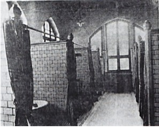
Waschkabinen im Wohlfahrtsgebäude

Wegen des Platzmangels gab es außer einigen Stühlen keine Möbel. Von den Wachmannschaften erhielten die Häftlinge nur trockenes Brot sowie dünnen Kaffee oder Brühe. Weitere Verpflegung brachten Angehörige. Misshandlungen und Folterungen der Inhaftierten standen auf der Tagesordnung.