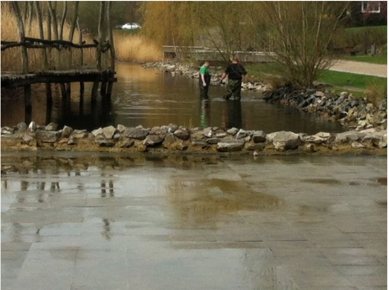
Reinigungsarbeiten im Teich im Wasserpark

Das Schilfbecken westlich der Gedächtnisstraße war bereits einem gründlichem Pflegegang im Winter durch Mitarbeiter des Baubetriebshofes unterzogen worden. Abgeschlossen wurde die Frühjahrsaktion durch Reinigungsarbeiten. Außerdem hielt das Flachwassebecken jede Menge frisches Wasser.