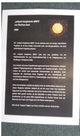
Plakat des Kulturreferats zum „subport bergkamen“