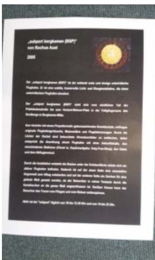
Plakat des Kulturreferats zum „subport bergkamen“