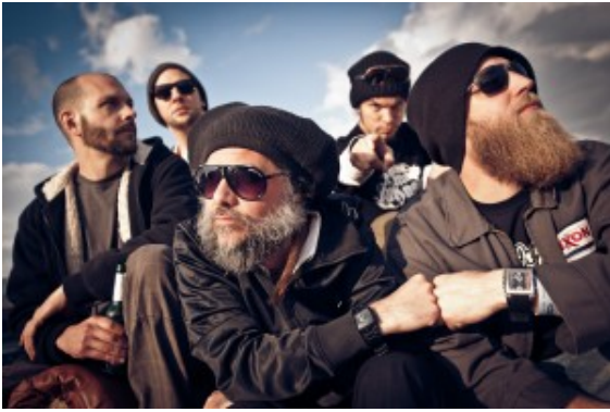
JAYA THE CAT