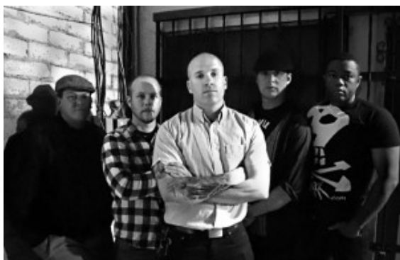
RAT CITY RIOT

Und das ist es auch. Bei den schnellen Beats und fixen Bassläufen kommt das Publikum oftmals ins Staunen. In ihrer Bandgeschichte führte es die Jungs in über 300 Konzerten durch ferne Länder wie die USA, Kolumbien, Dänemark, Spanien, Schweiz, England, Schottland und Italien. Erfolg ist sicherlich Definitionssache. Yacöpsae haben immer ihren Weg gemacht. Dabei stets verwurzelt in den Werten und Netzwerken der Punk- und Hardcorezene.