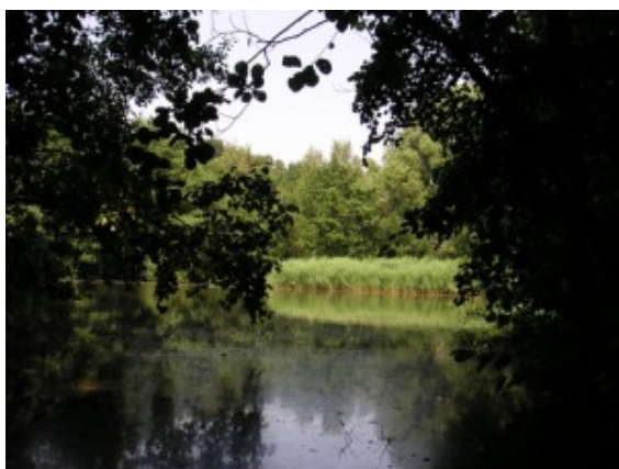
Gewässer im Mühlenbruch.

Zur traditionellen Familienwanderung am Himmelfahrtstag durch das Naturschutzgebiet Mühlenbruch in Weddinghofen lädt am Donnerstag, 9. Mai, der Naturschutzbund (NABU) ein. Treffpunkt ist um 10 Uhr das Gut Velmede.