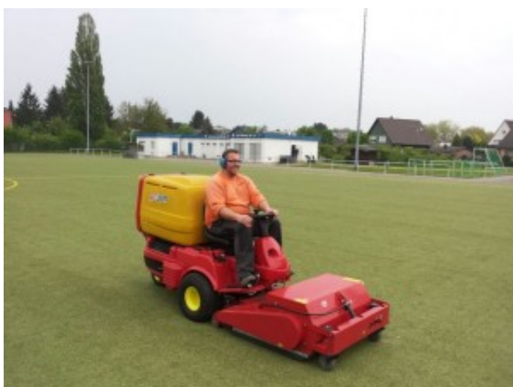
Das SMG - Gerät im

Die schöne Witterung nach der langen Winterzeit bedeutet auch für die Mitarbeiter der Sportplatzpflegekolonne des Baubetriebshofes der Stadt Bergkamen den Startschuss für umfangreiche Pflegemaßnahmen.