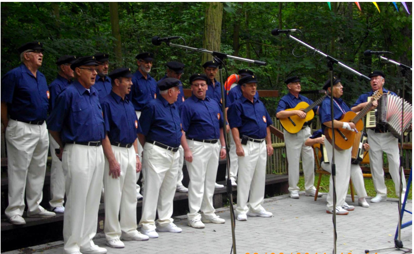
Blaue Jungs vom Wipperstrand Hettstedt

Am 14 Juni 1991 war der Chor der Walzwerker aus Hettstedt zu einem Besuch bei dem gemischten Chor Einigkeit Weddinghofen. Bei dem gemütlichen Beisammensein, am 15. Juni 1991 im Vereinslokal „ Zum schrägen Otto“ in Bergkamen Weddinghofen nahm auch der Shanty Chor Blaue Jungs vom Kuhbachstrand teil, der im Jahr 1980 von Sängern des gemischten Chores Einigkeit Weddinghofen gegründet wurde.