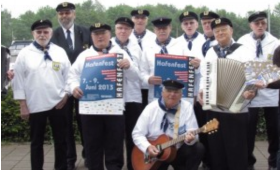
Shanty Chor MK Kamen/Bergkamen