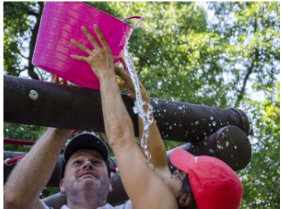
Feuchte Abkühlung von oben.

sorgten für Leckereien und Erfrischungen. Auch die Jugendfeuerwehr, Partner und hilfreiche Menschen aus Weddinghofen packten kräftig mit an.