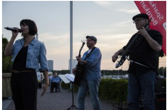
Prima Musik vor Hafen- und Industrie-Kulisse.

Die Idee, von einem Verleiher einen roten Teppich zu ordern und damit dem Kinovergnügen unter freiem Himmel ein kleines i-Tüpfelchen zu verleihen, kam jedenfalls an. Auch das vergrößerte Angebot von kulinarischen Köstlichkeiten fand seine Abnehmer: Popcorn in Riesentöpfen, Riesen-Pommes aus Holland, Fischbrötchen, Hot Dogs und Süßigkeiten lieferten das perfekte Ambiente. Das Vorprogramm mit der Band „Juicy Tones“ sorgte für die richtige Einstimmung.