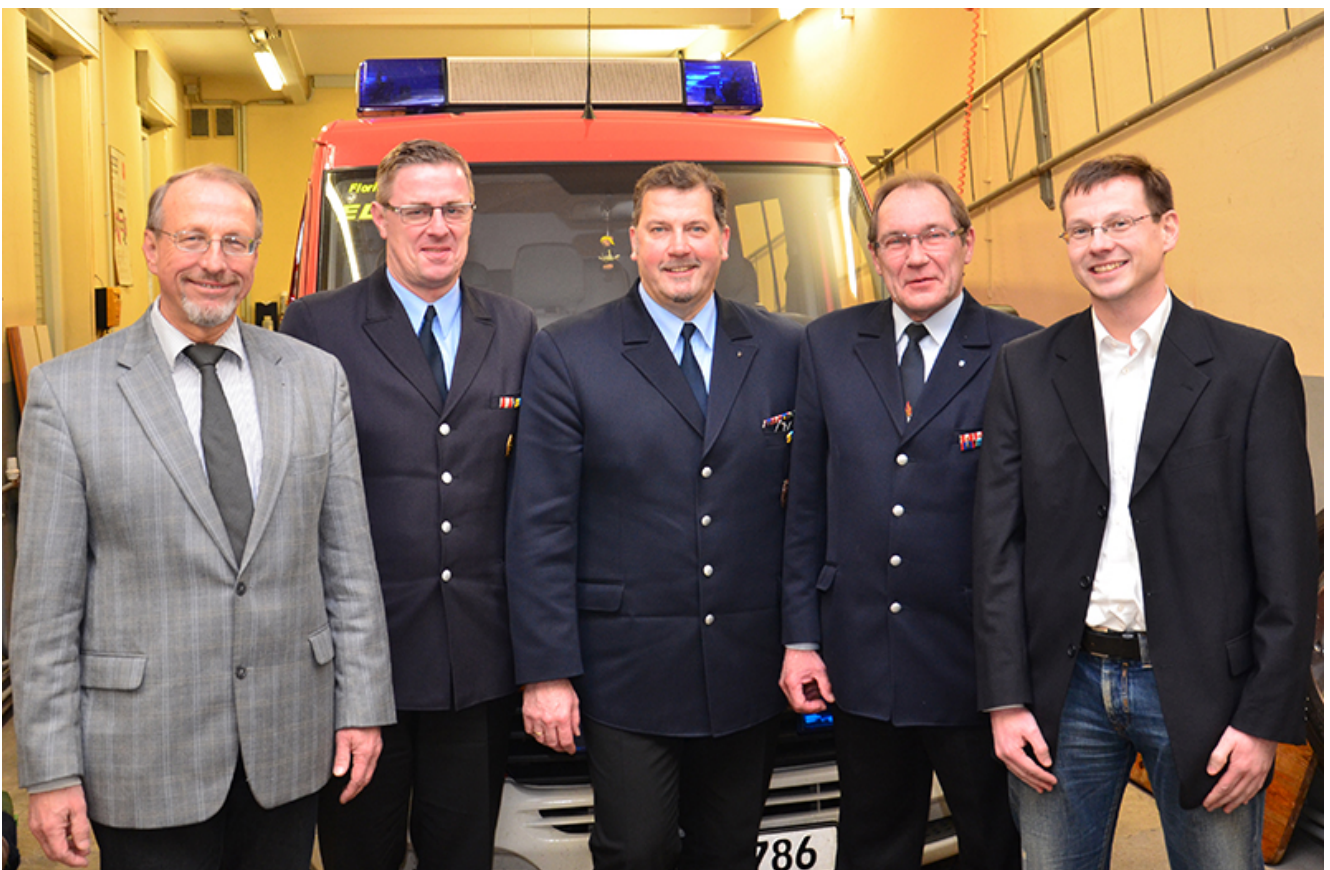
Die Wehrführung der Bergkamener Feuerwehr auf einen Blick.