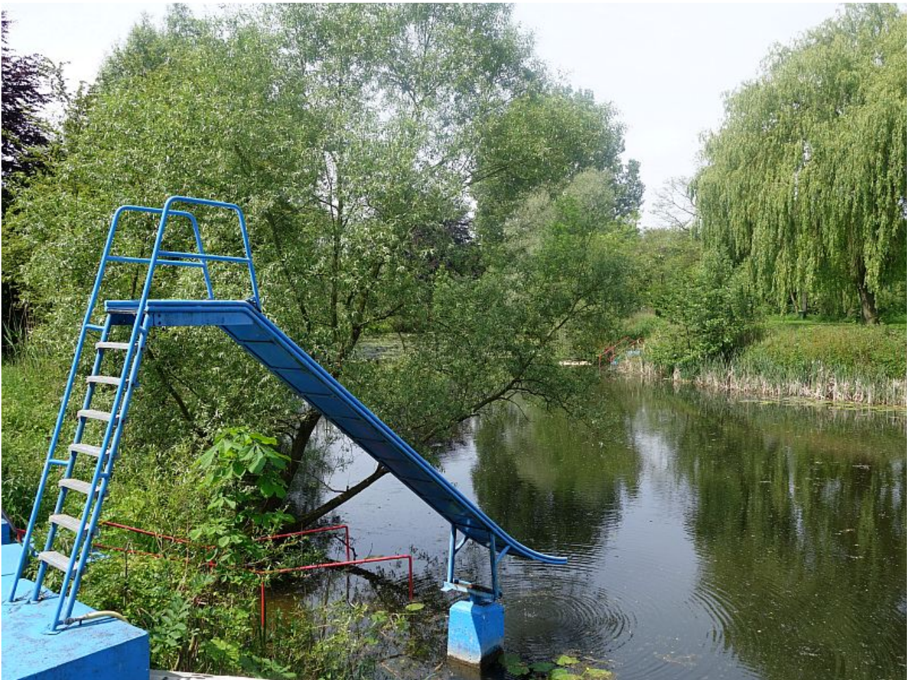
Idylle pur: das Naturfreibad Heil

Die Vatertagswanderer im Großraum Bergkamen müssen jetzt ganz tapfer sein: Die traditionelle Feier zur Saisonöffnung im Naturfreibad Heil fällt aus. Die DLRG verfügt ausgerechnet am Himmelfahrtstag, 29. Mai, über nicht genügend Personal, um dieses Event zu stemmen.