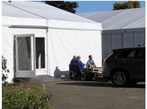
Das Aufnahmezelt von außen.

Getränkemarkts neben dem Ex-Aldi in Weddinghofen angemietet worden. Dort soll dann auch eine zentrale Spendenannahmestelle eingerichtet werden.