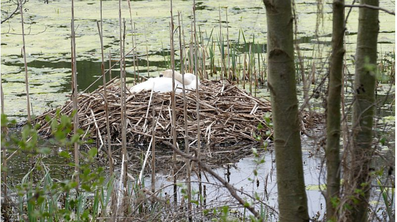
Schwanennest an der Erich-Ollenhauer-Straße

Der Schwanenweiher macht seinem Namen wieder alle Ehre. Vor einigen Wochen hat sich auf dem Gewässer an der Erich-Ollenhauer-Straße, das durch eine Bergsenkung entstanden ist, ein Paar dieser großen weißen Vögel niedergelassen. Die beiden Schwäne haben für sich und ihren künftigen Nachwuchs ein Nest gebaut.