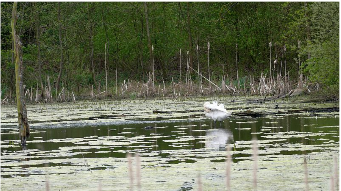
Schwanenweiher an der Erich-Ollenhauer-Straße.

Ungewöhnlich ist auch, dass die Schwäne ihr Nest so nah an der Erich-Ollenhauer-Straße gebaut haben. Ein möglicher Grund könnte sein, dass dort vor dem Hintergrund der Coronakrise wesentlich weniger Autos fahren und auch weniger Fußgänger unterwegs sind.