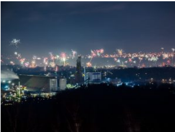
Auch das Werksgelände von Bayer gibt eine tolle Kulisse vor dem Silvesterfeuerwerk ab.

Eine Gruppe aus Werne freundet sich gerade mit Bergkamenern an. Keiner hat den anderen je gesehen. Egal, heute ist Silvester, da lernt man sich kennen. Aus Köln ist sogar jemand