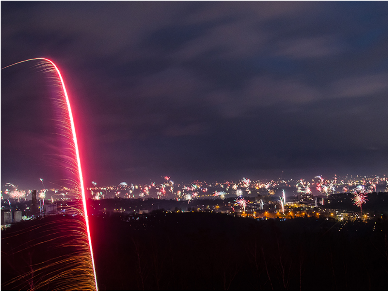
Toller Ausblick mit Querschlägern.