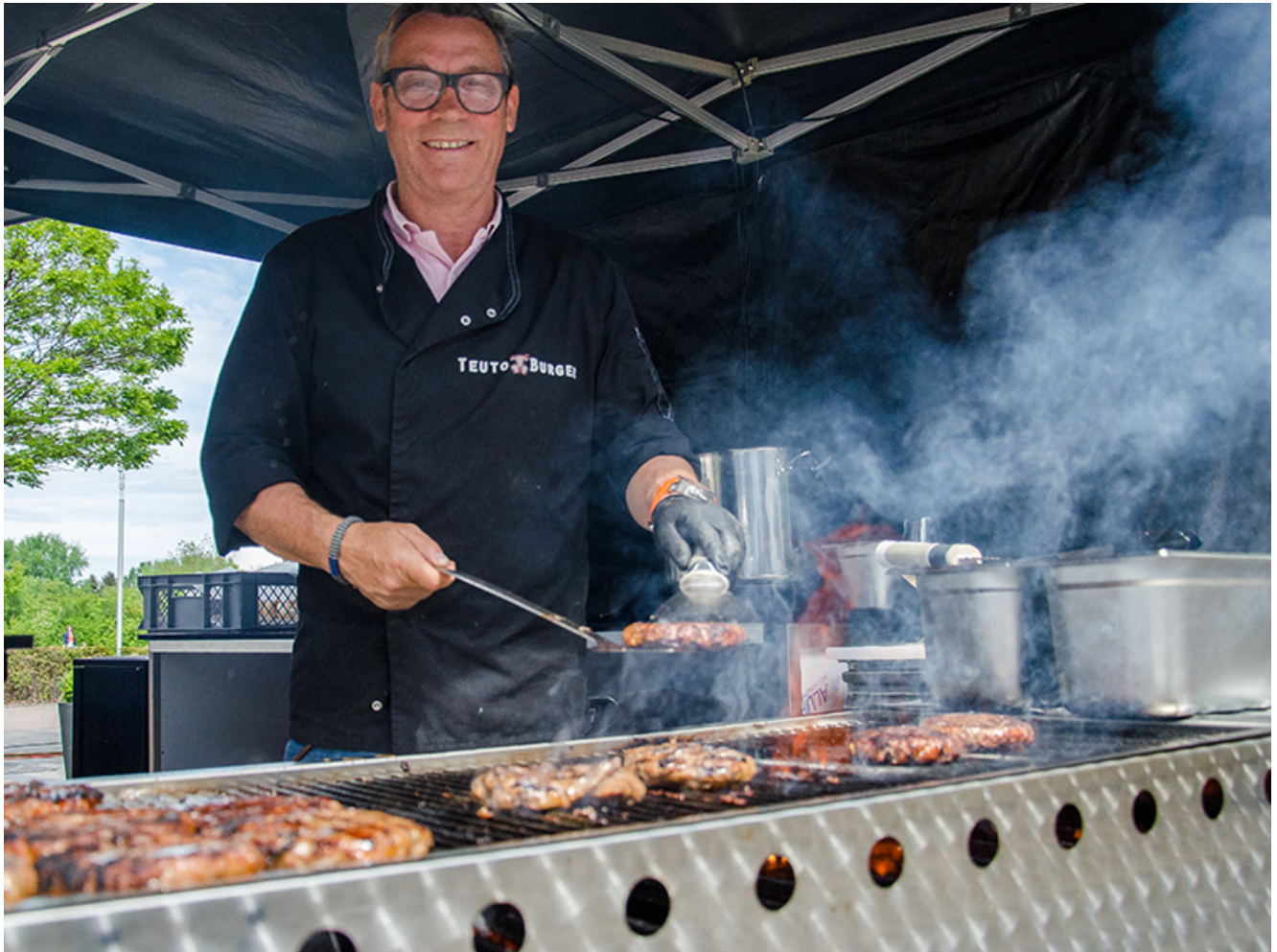
Impression vom Food Markt 2018