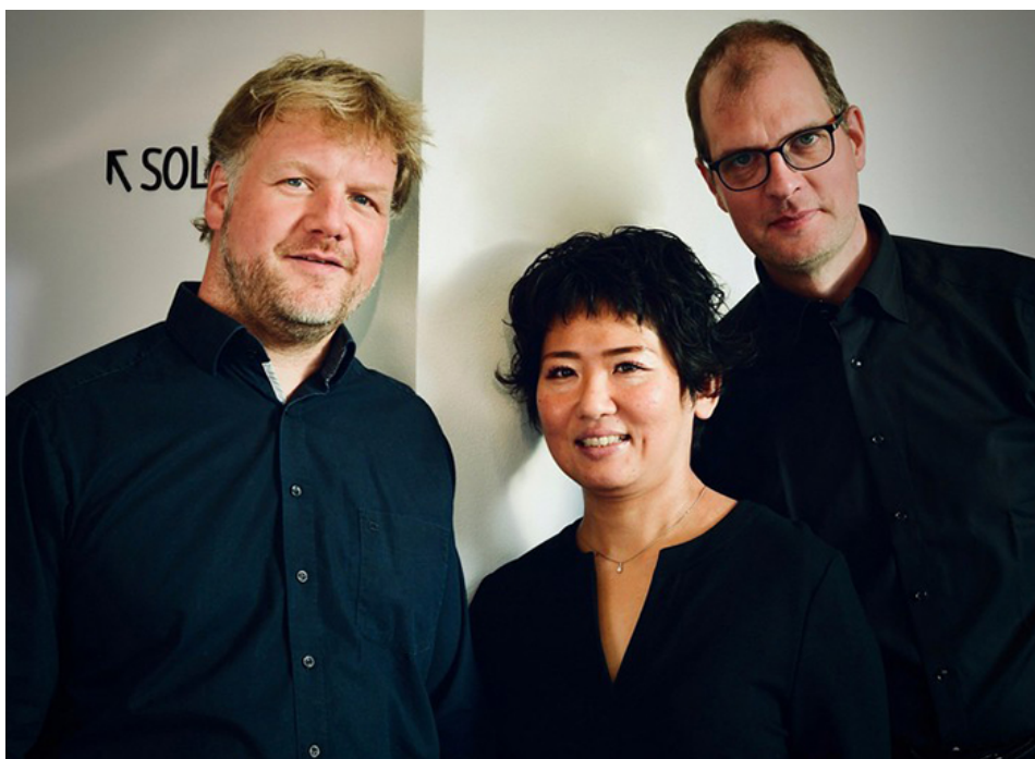
Trio BUCCINATE.

Im Programm des Jubiläumsjahres der Bergkamener Musikschule (1969-2019) stellen sich neben vielen Musikschülern und Musikschulensembles auch Dozenten der Musikschule in eigenen Konzerten vor. Für die nächste Jubiläumsveranstaltung dieser Art konnte neben dem Posauentrio des Stv. Musikschulleiters Thorsten Lange-Rettich auch der bekannte Bochumer Kabarettist Jochen Malmsheimer gewonnen werden.