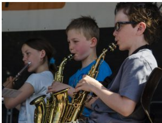
Die Jeki-Kinder zeigten auf der Bühne, was sie an den Instrumenten gelernt haben.

fündig. Auch wer den Muttertag bei dem großartigen Wetter schlicht verpasst hatte, konnte hier aus dem Vollen schöpfen. Herzen gab es zusammen mit Blumen in Hülle und Fülle. Und auch Alternativen zum Blumengeschenk, dank des verkaufsoffenen Sonntags, an dem sich zahlreiche große Händler über den Nordberg hinaus beteiligten.