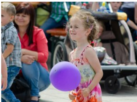
Eine begeisterte junge

Die Reservisten-Kameradschaft informiert nicht nur an einem Stand direkt neben den Seenotrettern und der Hafenpolizei darüber, dass sie bei den regelmäßigen Treffen politische Bildung, Sportabzeichen, Klettern, Ausflüge in Museen oder auch Schieß-Training im Angebot haben. Sie steigen auch ins Drachenboot, schon zum dritten Mal beim Hafenfest. Drei Mal hat die Truppe aus Lünen, zu der auch zwei ehemalige Bundeswehr-Soldatinnen gehören, vorher mit dem Paddel im mit Drachenkopf geschmückten Boot geübt. Es hat sich gelohnt: Vorläufig Platz drei in der Silbergruppe.