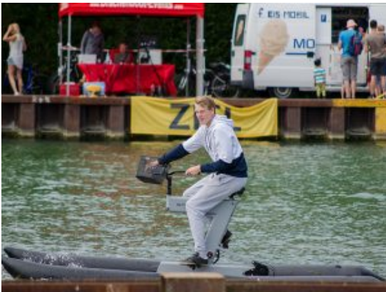
Mit dem Rad über's Wasser: Beim Hafenfest kein Problem.

Die Tour mit dem schwimmenden Fahrrad endete für die beiden Jungs relativ flott. Zügig waren sie losgestrampelt und umgehend in Algen und Tang gestrandet. Von ihrem unfreiwilligen Ankerplatz aus hatten sie immerhin exklusive