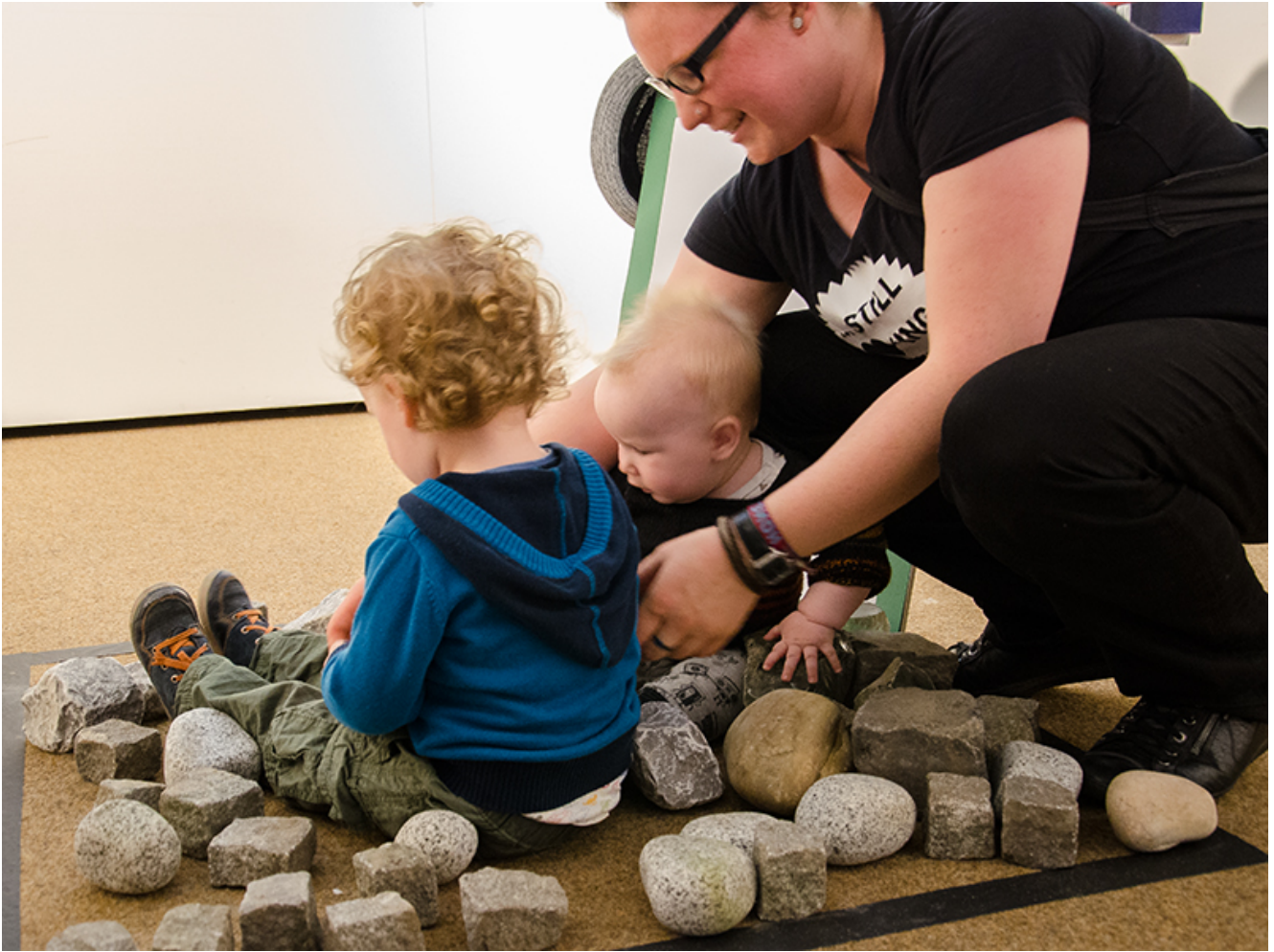
Kleine Künstler setzen Wegmarken.