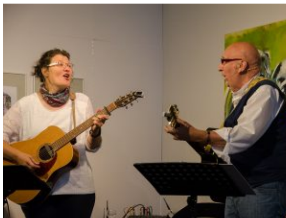
Das Duo „Mondi di Notte“ setzt musikalische Wegmarken

gleichbedeutend mit dem durchaus regionalspezifischen „ich bin dann mal weg“. Wohl eher stehen die Buchstaben aber für den Weg, vor den sich die Künstlergruppe vor 20 Jahren gemacht habe. Ein Weg, „auf den wir in Bergkamen sehr stolz sind“, so der Bürgermeister. Hier werde seitdem Kunst geschaffen, „die etwas bewegt – ein wichtiger und wertvoller Beitrag.“