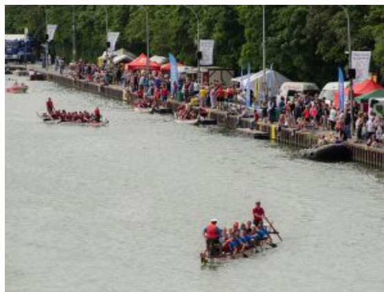
Drachenboote auf dem Weg zur Startlinie.

Spitze der Stäbe leisten gute Dienste dabei, den Sparkassen-Mitarbeiter oder den DLRG-Lebensretter oder sonst jemanden aus den insgesamt acht Teams ins immer noch recht frische Nass zu befördern. Zum Glück sind andere Lebensretter zur Stelle, um alle mitsamt Schwimmwesten wieder auf das Trockene zu retten.