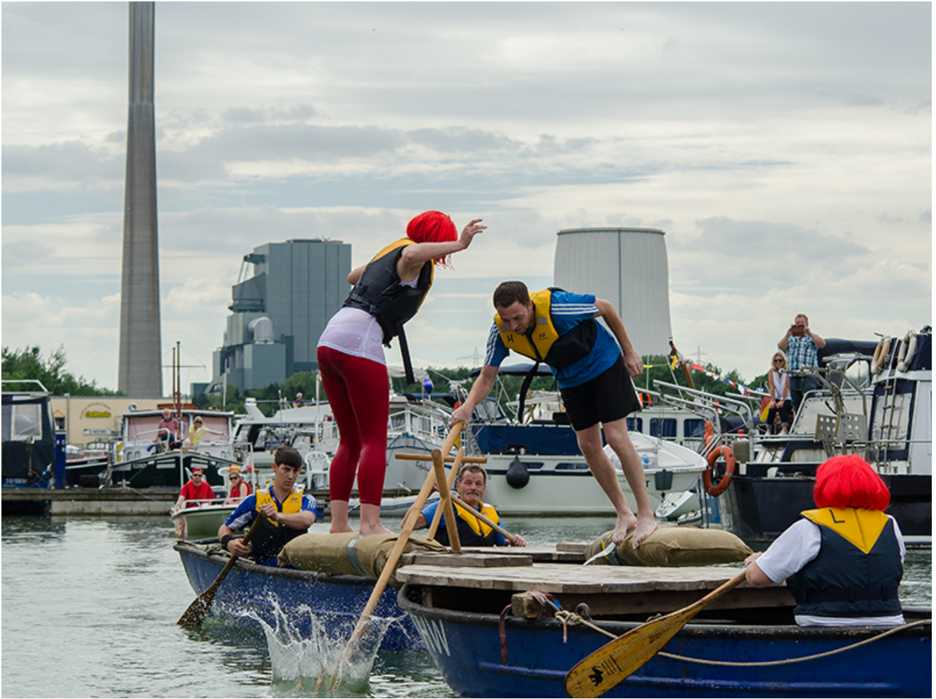
Ab ins Wasser: Beim Fischerstechen geht's hoch her.