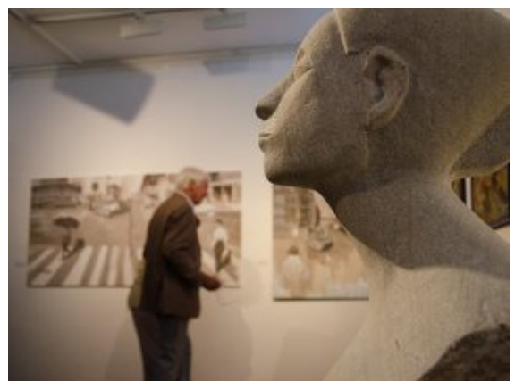
Auf dem Weg durch die Ausstellung.