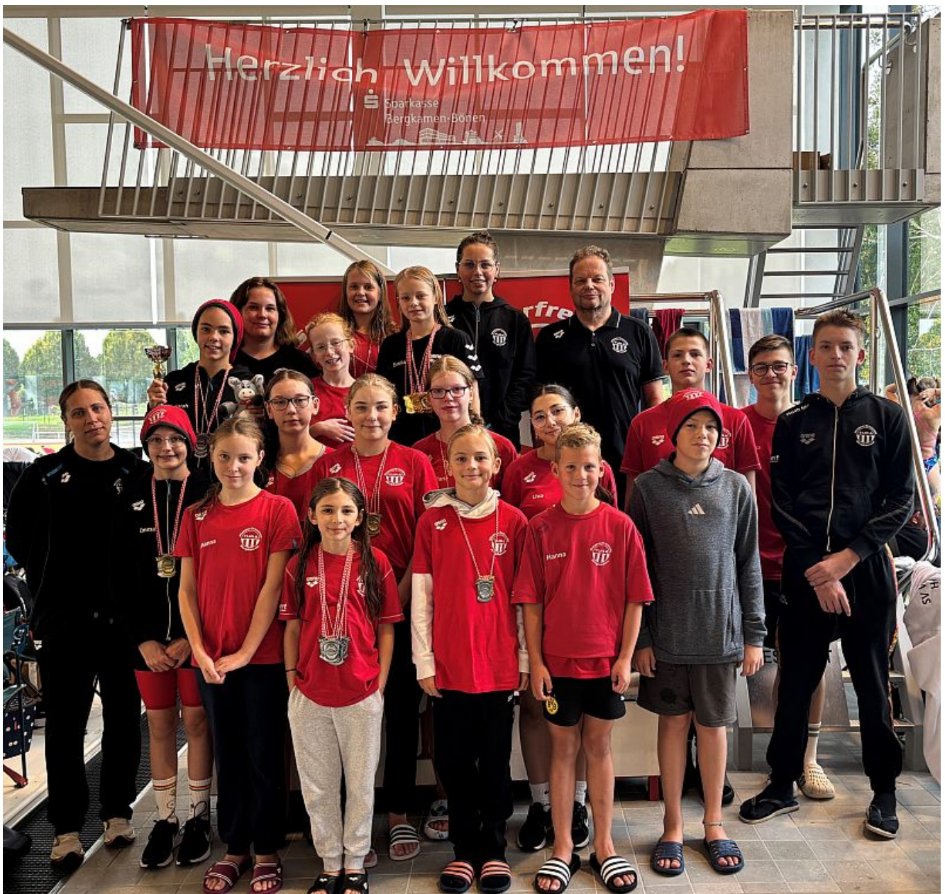
Mannschaftfoto Wasserfreunde TuRa Bergkamen.

Am 20. und 21. September richteten die Wasserfreunde TuRa Bergkamen ihr 49. Internationales Schwimmfest erstmals im