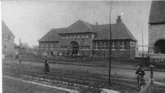
Ehemaliges Wohlfahrtsgebäude in der Bergarbeitersiedlung Schönhausen