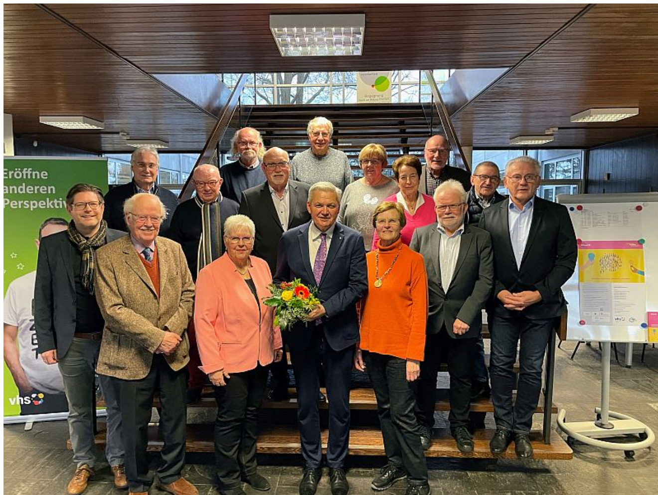
Der neue Vorstand der Senioren Union.