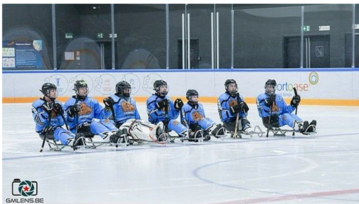
Mannschaft der Grizzlys Bergkamen

Die Para-Eishockeymannschaft der Grizzlys Bergkamen schlagen die Phantoms in Antwerpen verdient mit 3:0.