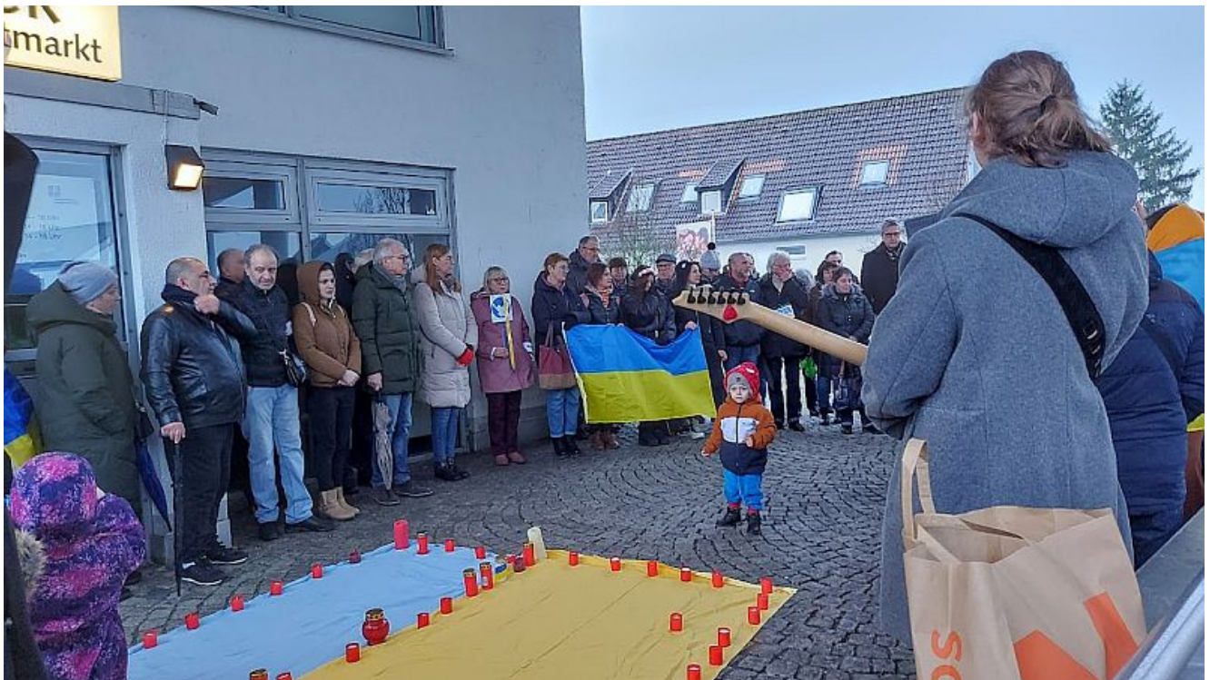
Gedenkveranstaltung ukrainischer Flüchtlinge am 24. Februar 2023 vor der Stadtbibliothek.