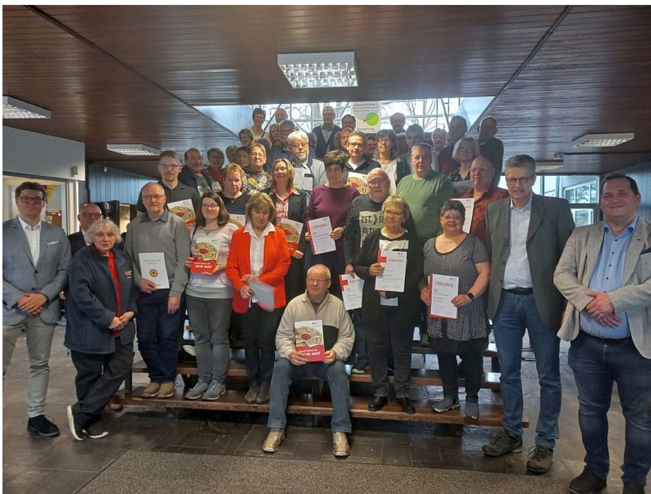
Blutspenderehrung durch den DRK-Ortsverein Bergkamen.