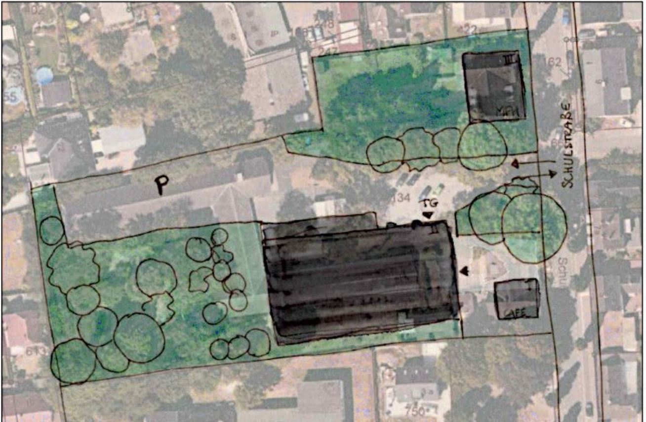
Darstellung einer möglichen künftigen Flächennutzung für das Grundstück Albert-Schweitzer-Haus

CDU fordert sechs gebührenpflichtige Wohnmobilstellplätze am