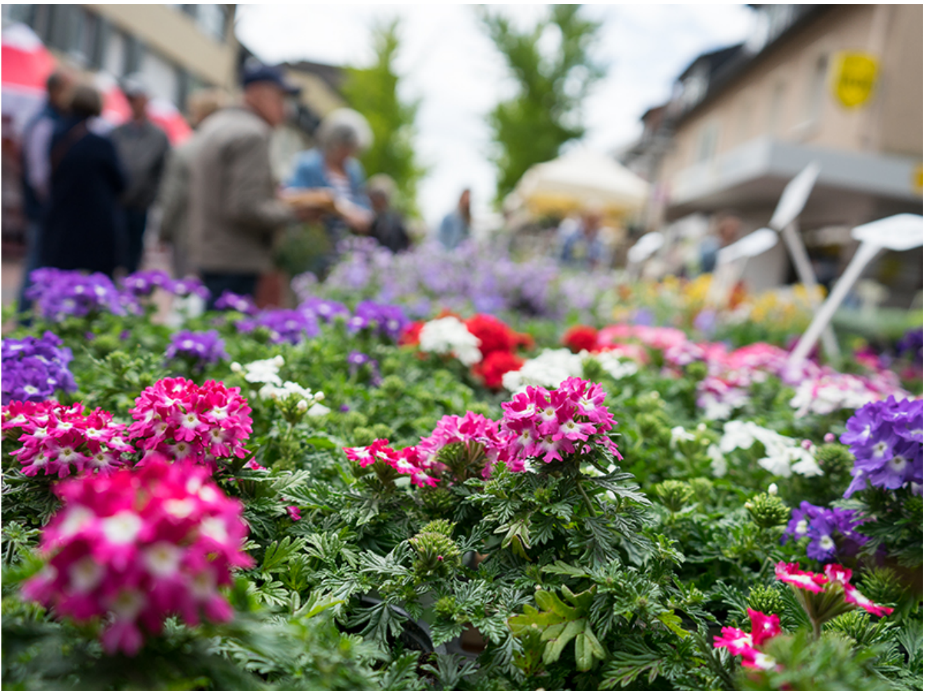
Blühende Landschaften in der Fußgängerzone.