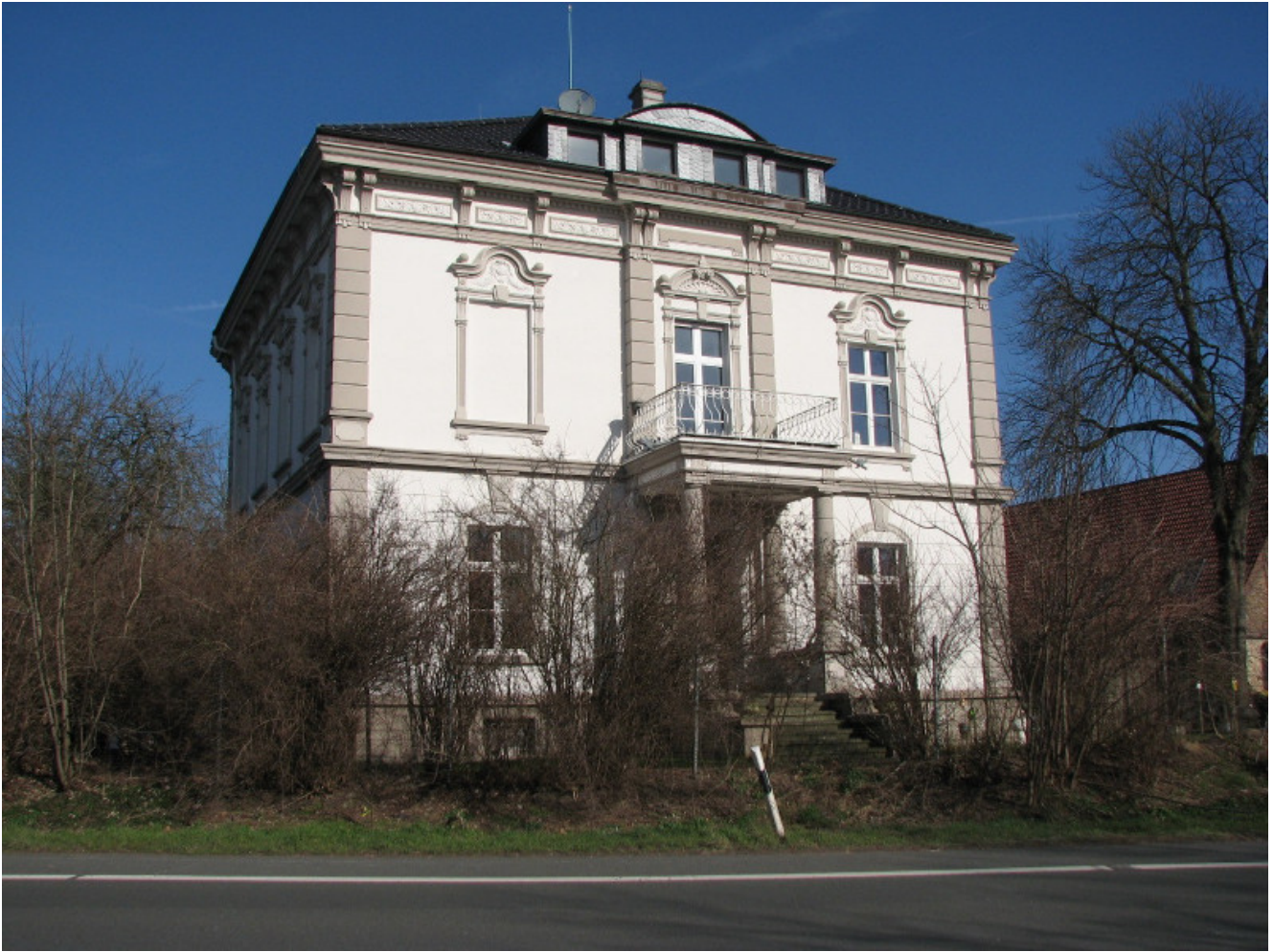
Haus Rünthe, Ostenhellweg 47

Zwei Führungen durch Rünthe und den Römerpark bietet der Bergkamener Gästeführerring am kommenden Wochenende an sowie der erste Gang in diesem Jahr über die Großbaustelle „Wasserstadt Aden“ am Dienstag.